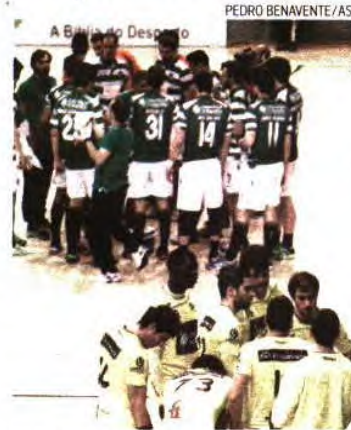
Sporting e ABC, reencontro em Braga