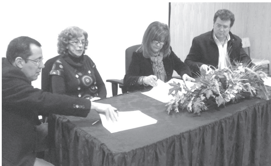
Assinatura do protocolo da cooperação com a Federação de Andebol

Foi ainda assumido um protocolo com o Centro de Formação de Professores da Associação de Escolas da Beira Interior, para implementação de ações de formação creditadas para professores de Educação Física, de forma a "fidelizar" o Andebol como modalidade de Des-