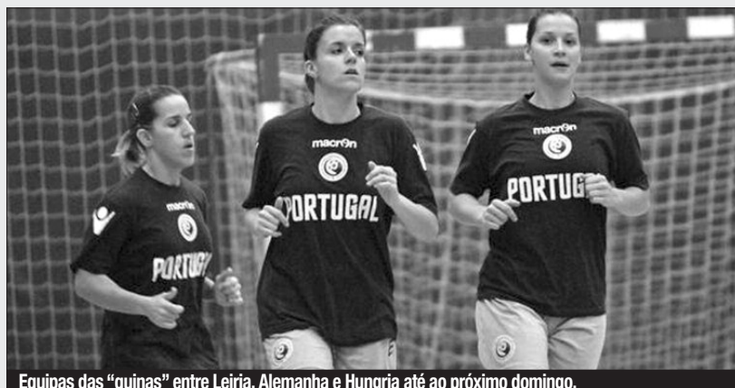
Equipas das “quinas” entre Leiria, Alemanha e Hungria até ao próximo domingo.