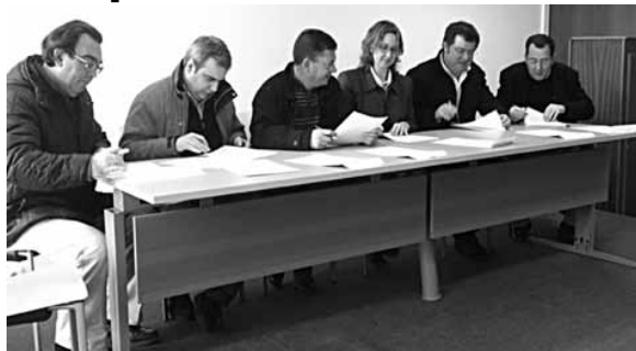
Federação assina protocolos de modo a fazer renascer o andebol no concelho