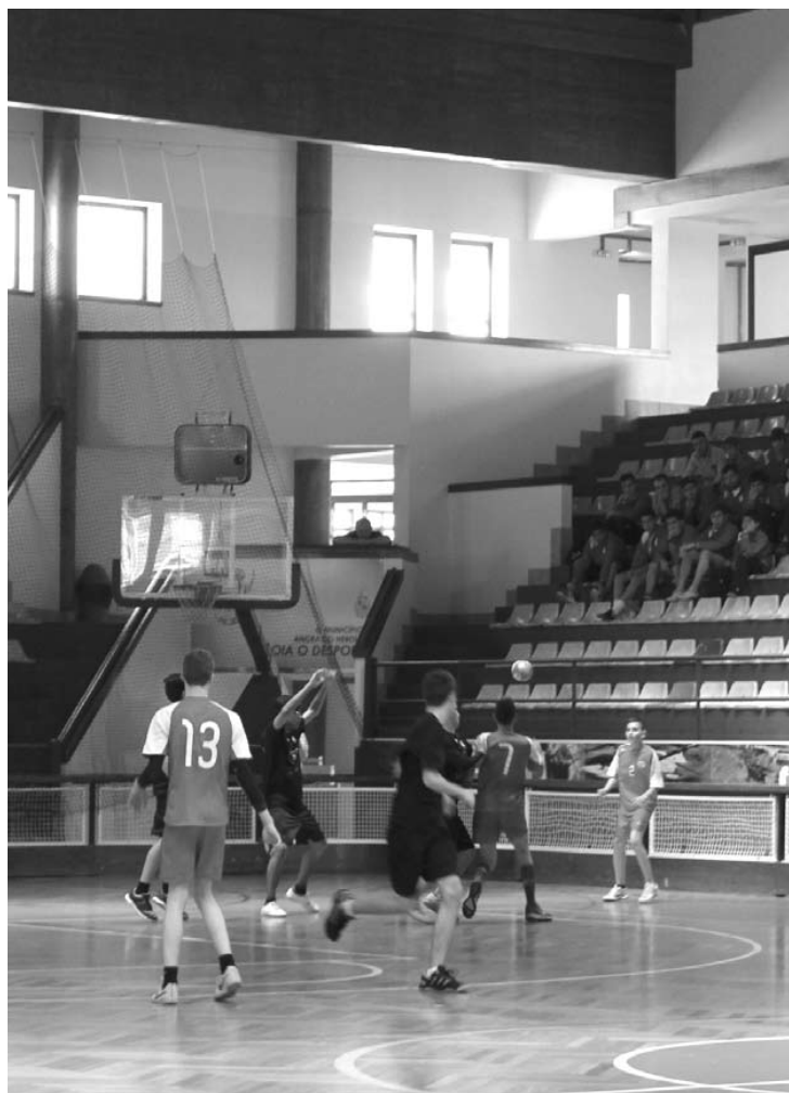
PAVILHÃO MUNICIPAL acolheu Campeonato Regional de Iniciados

O quadro da classificação geral ficou assim estabelecido (todas as equipas com quatro jogos concretizados): 1.º ACDR Graciosa 11 pontos (3V1E0D, 107-68 em golos), 2.º SC Angrense 11 pontos (3V1E0D, 105-70 em golos), 3.º GDGP Arrifes 8 pontos (2V0E2D, 116-105 em golos), 4.º GD Biscoitos 6 pontos (1V0E3D, 114-139 em golos), 5.º ADEC 4 pontos (0V0E4D, 59-119 em golos). ❧