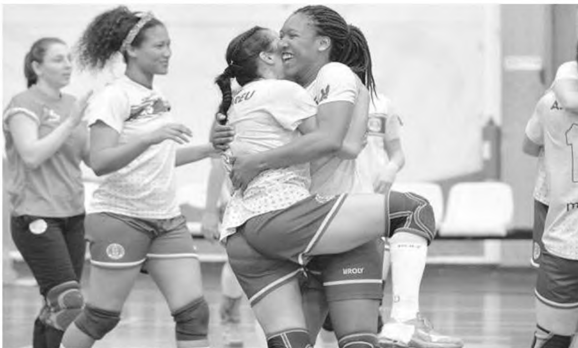
Equipa tinha de pagar cerca de 15 mil euros para se inscrever e ainda efectuar obras no pavilhão.