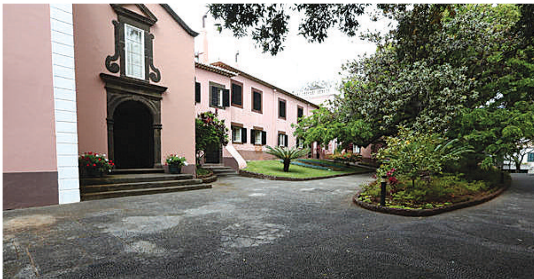
O conselho de governo louvou a equipa feminina do Madeira Andebol SAD.

O executivo aprovou o Plano de Combate aos Incêndios Florestais para os meses de maior risco.