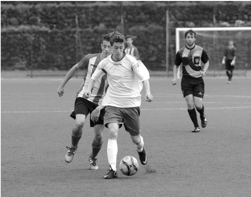
PRESENTE EDIÇÃO dos Jogos conta com um número elevado de atletas