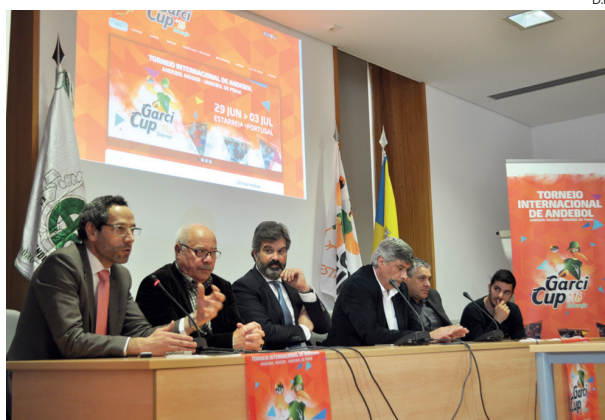
Elementos organizativos empenharam-se na divulgação do evento

Este ano volta a haver novidades, desde logo porque, em termos desportivos, a presença de uma equipa alemã tornará o torneio ainda mais internacional, já para não falar do aumento do número de equipas oriundas da vizinha Espanha. Numa outra vertente, o Garcicup 2016 vai ter, a partir do dia 25 de Junho, a funcionar um “campus” onde cerca de 60 jovens atletas vão aprender as técnicas da modalidade e receber algumas “dicas” dos inter-