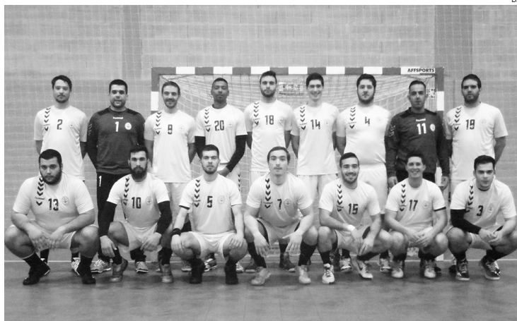
A equipa do Beira-Mar, se vencer amanhã o Monte em Angeja, garante a subida de divisão

A distância para o seu opositor no marcador foi aumentando e, aos 15 minutos de jogo, a diferença era já de seis golos (11-5), o que desde logo tranquilizou a equipa do Beira-Mar.