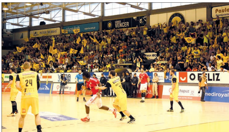
ABC garantiu, pelo menos, para o Sá Leite, o jogo do título