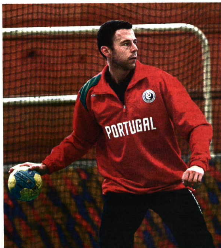
OTIMISMO. Internacional confiante numa boa participação

atuarmos antes de disputar a qualificação, visto que não podemos entrar já em competição”, referiu o guarda-redes português.