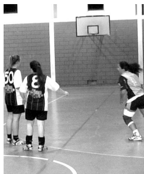
S. Félix imparável

Com quatro vitórias e uma derrota, o CA São Félix teve um fim-de-semana positivo em quase todos os escalões. As seniores receberam e venceram o Lusitanos por um esclarecedor 35-19. A equipa entrou com vontade e determinação em garantir a vitória e para isso montou uma estrutura defensiva que impediu a equipa contrária de ter êxito e permitiu às gaienses lançar vários contra-ataques e ataques rápidos que decidiram o rumo da partida. Hoje, as atletas vão jogar ao pavilhão do Cale em jogo antecipado da quinta jornada.