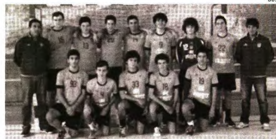
Iniciados Masculinos do Externato Dom Fuas Roupinho

Na 18ª e última jornada do Campeonato Nacional de Iniciados Femininos, zona 4, O Externato Dom Fuas Roupinho venceu no dérbi com o Cister SA, (36-23), terminando a competição no 3º lugar com 40 pontos, enquanto as Alcobacenses ficaram no 6º lugar com um total de 29 pontos. Em jogo da 17ª ronda, o Externato Dom Fuas Roupinho foi vencer fora o SIR 1º Maio, (16-35).