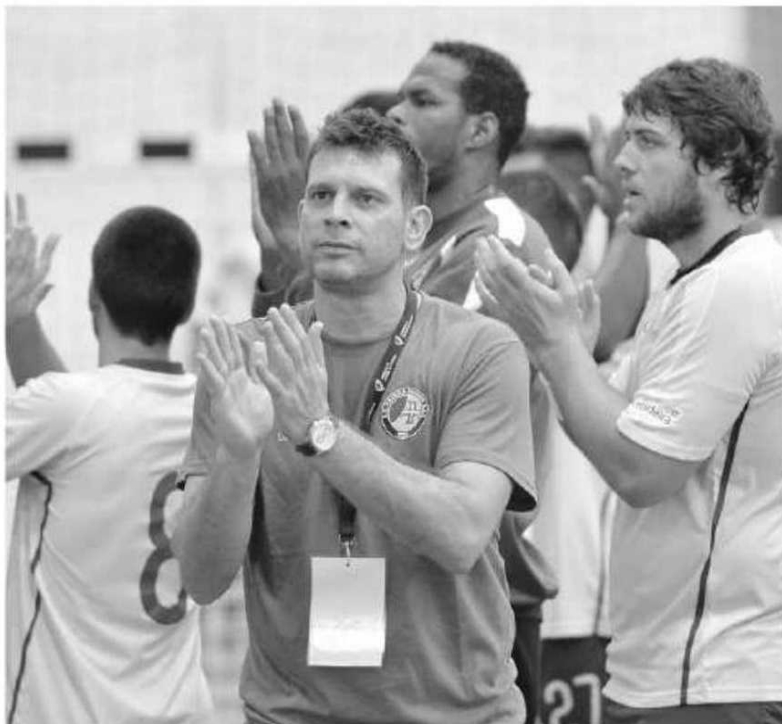
Madeira Andebol SAD está a realizar um arranque de grande nível.

"Obviamente que só podemos estar felizes com os seis pontos conseguidos nas duas primeiras jornadas. Foram duas vitórias importantes que nos motivam ainda mais, que nos ajuda a trabalhar com mais empenho mas apenas isso. A euforia é fortemente inimiga do bom senso e neste momento creio temos de continuar o nosso caminho com muita humildade. O