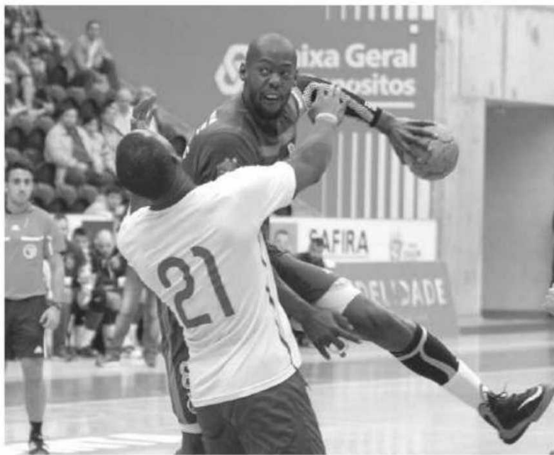
Madeirenses perderam em casa do campeão

Foi no início do segundo período que quase tudo se decidiu. Um