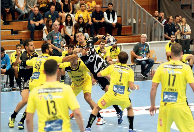
Fase do jogo entre o ABC/UMinho e Bregenz, disputado, domingo, na Áustria