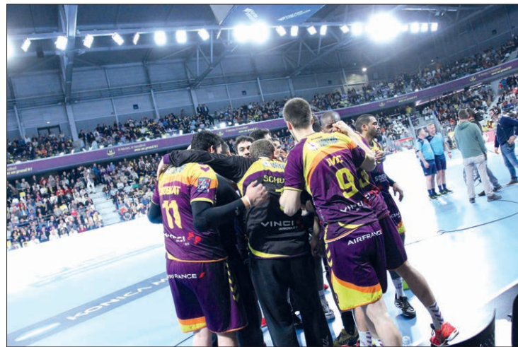
O palco onde jogam os franceses do HBC Nantes