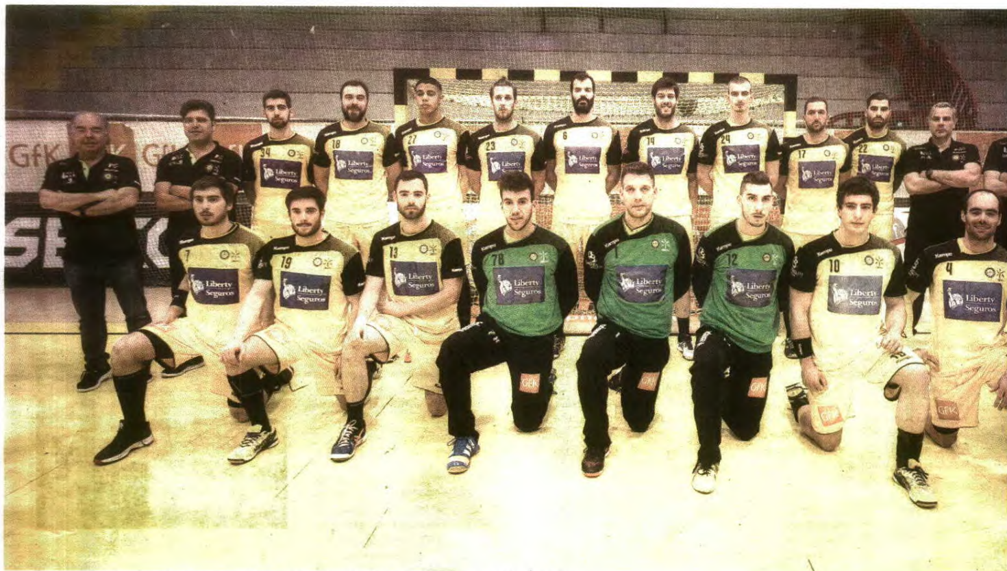
A sensacional equipa bracarense, que conquistou a Taça Challenge e pode, logo à noite, sagrar-se campeã nacional no Pavilhão da Luz