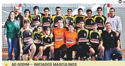
● AD GODIM – INICIADOS MASCULINOS