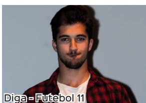
Diga - Futebol 11