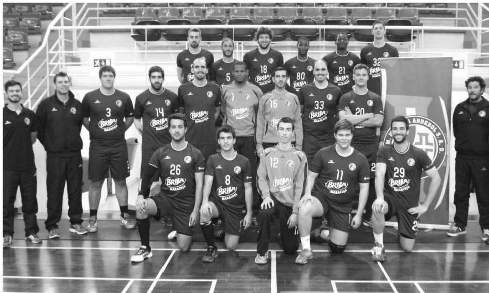
Madeira SAD leva o sonho da conquista na bagagem.

"É uma honra estarmos envolvido nesta 'Final-Four' juntamente com 3 grandes emblemas do desporto nacional. Sentimo-nos os mais 'atractivos' da prova, uma vez que, imagino que todos quisessem ter o Madeira SAD pela frente na meia-final. O Sporting eliminou o ABC de Braga de forma convincente, e tem como objectivo vencer a taça de Portugal. Vamos procurar estar na competição com a mesma identidade que temos tido no campeonato. Estar ao mesmo nível desportivo dos maiores emblemas de Portugal, procurando ter uma meia-final equilibrada e procurando a suplantação de forma a abrirmos a porta à presença na final. Seria um enorme feito para o desporto madeirense este grupo estar na final de domingo, é com isso que iremos sonhar e trabalhar".