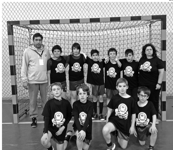
A equipa do Alavarium que competiu em Castelo Branco