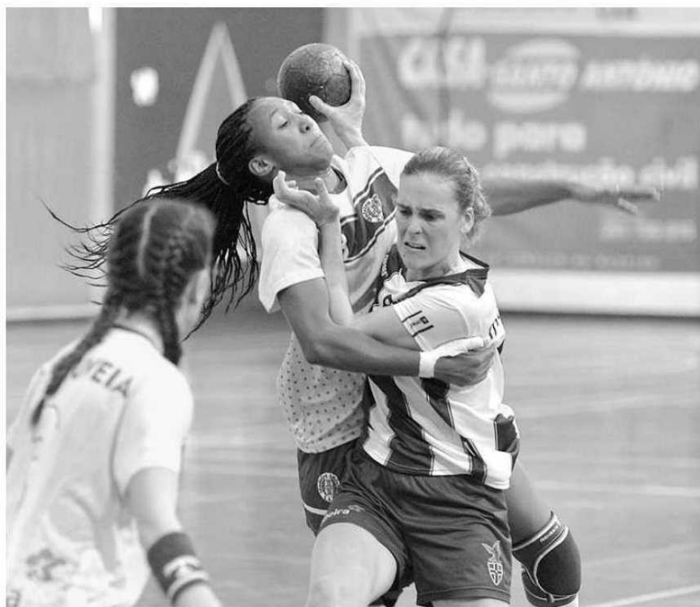
Sports Madeira e Madeira SAD estão na luta pelo troféu.

"Em virtude de, até a presente data, nenhuma companhia aérea ter confirmado as viagens para os clubes do Continente se deslocarem à Região Autónoma da Madeira, entre os dias 15 e 17 de abril de 2016, a 'final-four' da Taça de Portugal foi alterada para os dias 28 e 29 de Maio", justificou ontem a Fe-