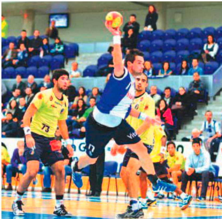
Madeira SAD foi ao 'Dragão Caixa' perder naturalmente.

Na I Divisão em seniores femininos, registe-se o regresso do campeonato nacional, com as duas equipas da Região envolvidas neste fim de semana numa jornada dupla. Ontem destaque para a du-