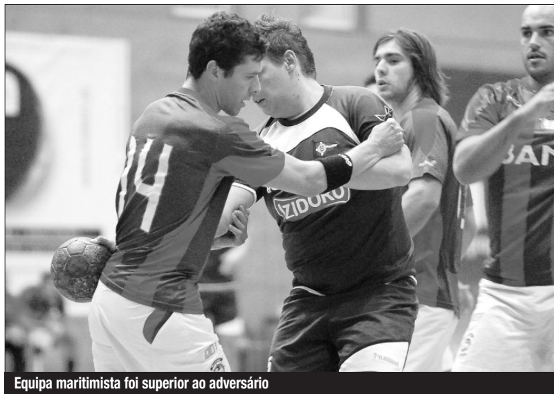
Equipa maritimista foi superior ao adversário

Na frente está Sismaria, que ontem venceu no reduto do Samora Correia, por 26-24. tem 21 pontos