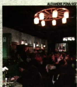
Leões ouviram Ronaldo com atenção