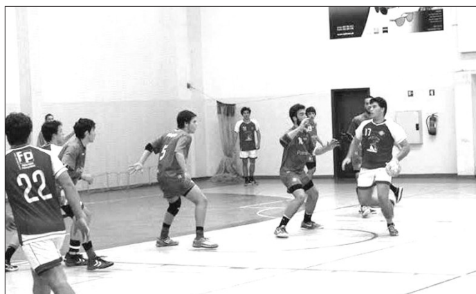
Após uma semana de pausa, pavilhões da Madeira receberam jogos dos "regionais".

DEPOIS DE UMA PARAGEM NAS COMPE- TIÇÕES, PARA DAR LUGAR À REALIZA- ÇÃO DO XXVII TORNEIO ANIVERSÁRIO DA ASSOCIAÇÃO DE ANDEBOL DA MADEIRA, A ATIVIDADE REGRESSOU NO PASSADO FIM DE SEMANA, COM A REALIZAÇÃO DE DIVERSOS JOGOS, NAS RESPECTIVAS CATEGORIAS. MAIOR ÊNFASE PARA O DESAFIO ENTRE BARTOLOMEU PERESTRELO E ACADÉMICO DO FUNCHAL, EM JUVENIS MASCULINOS, COM VITÓRIA DA PRIMEIRA EQUIPA, POR 25-20. REGISTO AINDA PARA O ACADÉMICO - MADEIRA SAD, EM INICIADOS MASCULINOS, COM VITÓRIA TANGENCIAL DA SAD: 28-27.