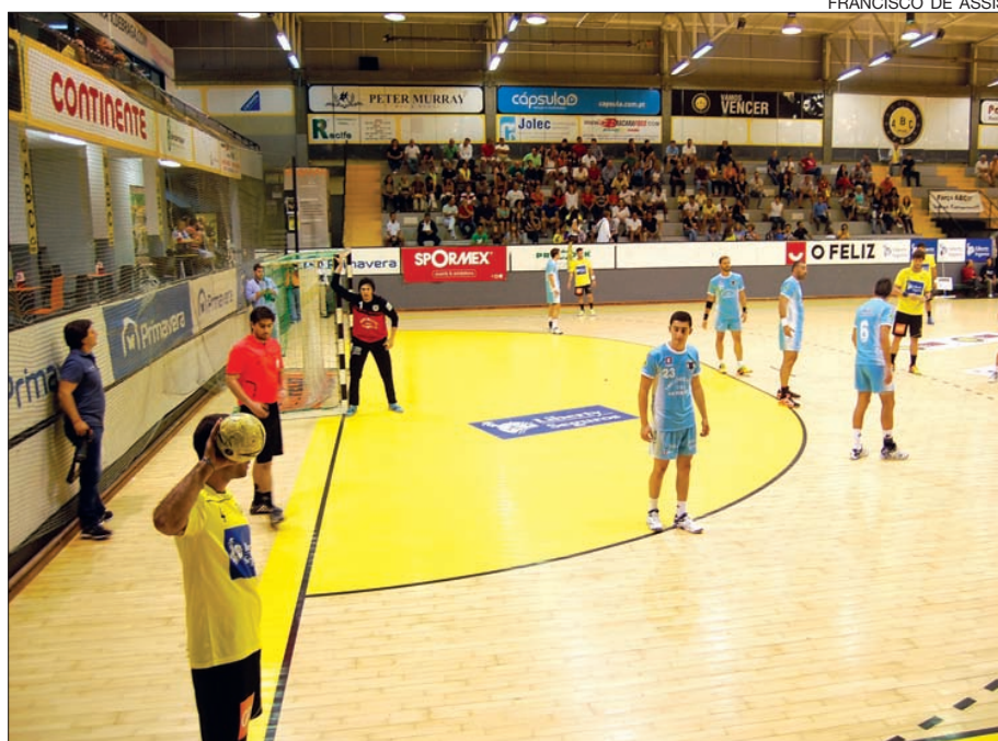
FRANCISCO DE ASSIS

Equipa do ABC/UMinho perdeu o jogo, mas o técnico disse ter gostado da exibição