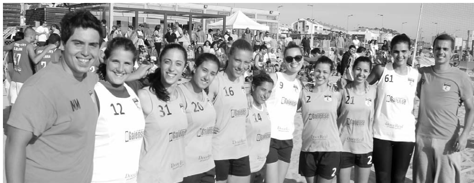
Equipa 'Últimas a Sair' do ano passado chegou à fase final, disputada em Portimão, mas não conquistou o título nacional

Lembrando que no andebol de praia "os golos têm de ser marcados com o movimento de pirueta", o