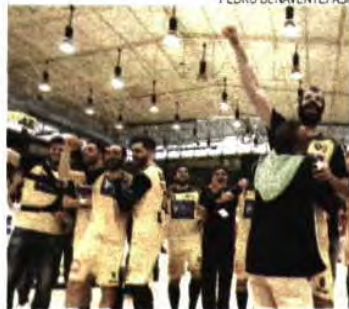
Sorteio do ABC será dia 29, em Viena