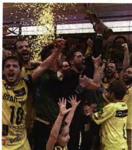
ABC vai ter qualificação na Champions

tuguês integra o lote de oito equipas que na próxima quarta-feira serão sorteadas em dois grupos, para apurar o vencedor de cada um deles. Os jogos serão no primeiro fim de semana de setembro e ABC pode ter como rivais Red Boys (Luxemburgo), Velenje (Eslovénia), Bregenz (Áustria), Maccabi Telavive (Israel), Tatra Presov (Eslováquia), Cocks (Finlândia) ou Achilles Bocholt (Bélgica). —A.F.