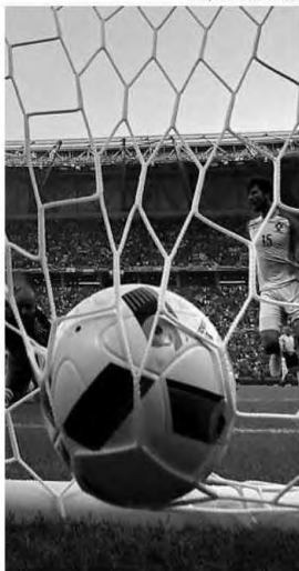
69 golos apontados em 36 jogos