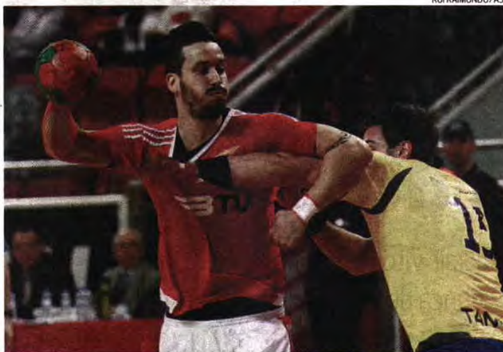
Encarnados ganharam vantagem muito confortável para o jogo da 2. a mão, na Noruega

E, entre os postes, contou com um guarda-redes em grande mo-