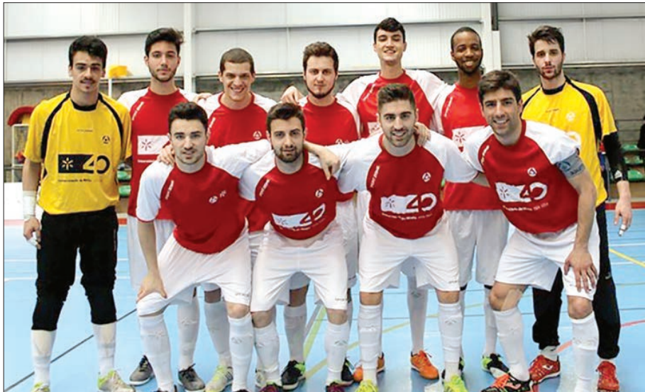
Os bicampeões nacionais de futsal