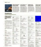
Tabela de Classificação

6ª Jornada SIR 1º Maio 25 Ass. Vale Grande 23 Académico FC 17 - Vela Tavira 13; CP Valongo 25 - Ilhavo AC 33; Modicus Sandim 18 - Juventude Mar 24