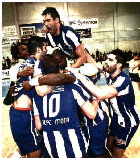
Dragões tricampeões nacionais de andebol

O póquer de títulos está ao alcance e com o valor acrescentado de o futebol poder somar ao seu palmarés uma competição europeia. Foi o que aconteceu em 2003/04, o célebre ano do triunfo na Champions em Gelsenkirchen. Ao