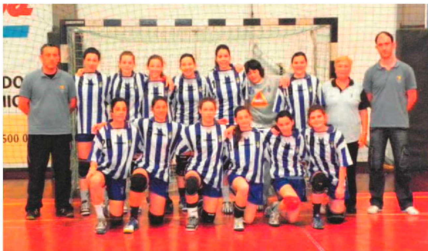
Juniões do CS Madeira lutam pelo título nacional entre 3 a 5 de Junho.

No passado fim-de-semana os escalões mais baixos lutaram por 'preciosos' pontos no que concerne à prova de 'encerramento' enquanto nos juvenis femininos arancou a primeira fase da Taça AAM onde se apuraram os dois primeiros classificados de cada grupo que irão jogar a fase final.