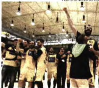
Sorteio do ABC será dia 29, em Viena