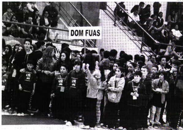
Nazaré Cup levou de novo muitos andebolistas e espectadores à vila