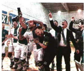
TAÇA DE PORTUGAL. Após afastar o Valongo, leões defrontam a Oliveirense