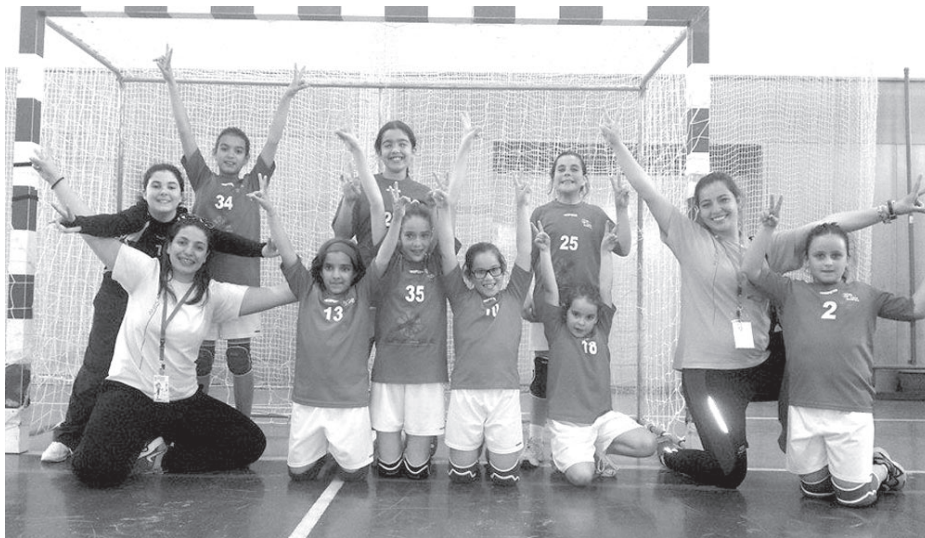
ACBCB foi a única equipa exclusivamente feminina

Chegou ao fim o 3º Torneio de Andebol Cidade de Castelo Branco, organizado pela Associação Desportiva Albicastrense (ADA) em parceria com a Associação de Andebol de Castelo Branco. Este torneio que decorreu entre os dias 2 e 4 de abril destinou-se aos escalões de minis e infantis. Mais uma vez a CBCB esteve pre-