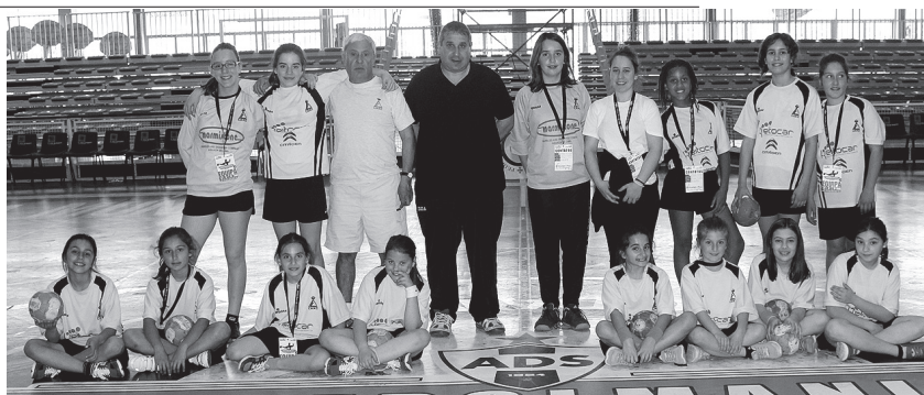
▲ Infantis da LAAC

Além deste escalão, o torneio da Sanjoanense destinou-se ainda aos escalões de infantis masculinos (20 equipas), iniciados femininos (14) e masculinos (16) e juvenis femininos (12) e masculinos (12).