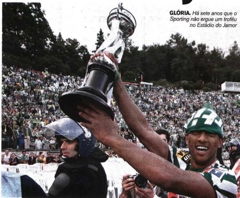
GLÓRIA. Há sete anos que o Sporting não ergue um troféu no Estádio do Jamor

rios que lutam por iguais objetivos. Mas, como assumiu José Mourinho, antes da final da Liga Europa, diante do Benfica, “as finais são para ganhar”. Terá de ser com este espírito que as equipas verdes e brancas terão de encarar os decisivos encontros que se aproximam. E manter o espírito ganhador que esta direção tem conseguido transmitir.