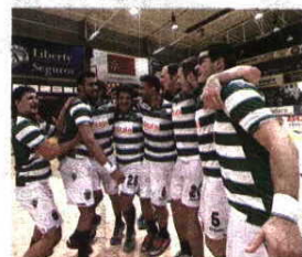
ANDEBOL. Título começa a discutir-se a 9 e 13 de maio no Pavilhão do FC Porto