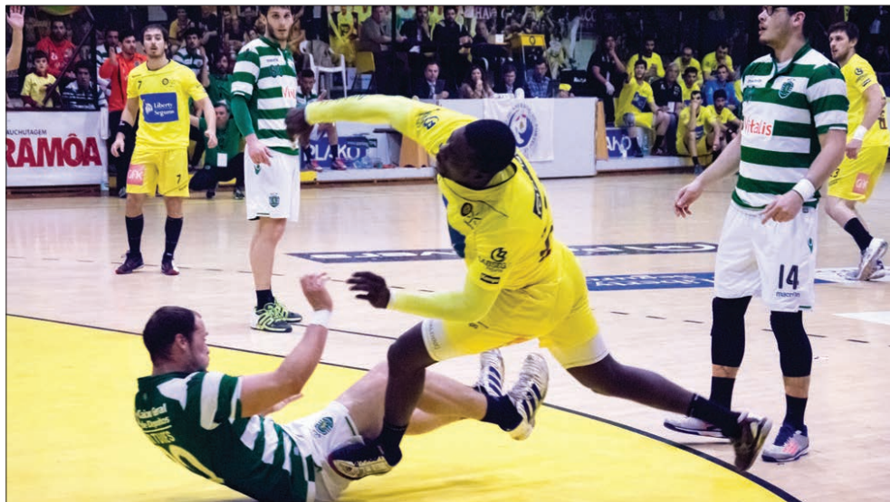
Teca remata à baliza do Sporting