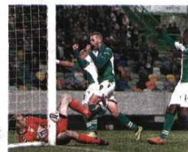
JAMOR. Ultrapassado o Nacional, o Sp. Braga perfila-se como adversário provável