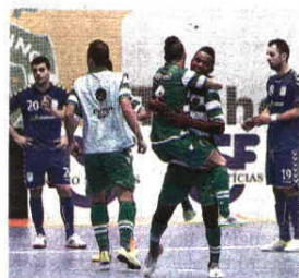
FUTSAL CUP. De 24 a 26 de abril, leão enfrenta Barcelona, Kairat Almaty e Dinamo Moscovo