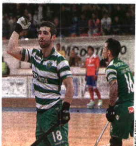
TAÇA CERS. Oliveirense ficou pelo caminho, seguem-se Réus, Igualada e OC Barcelos