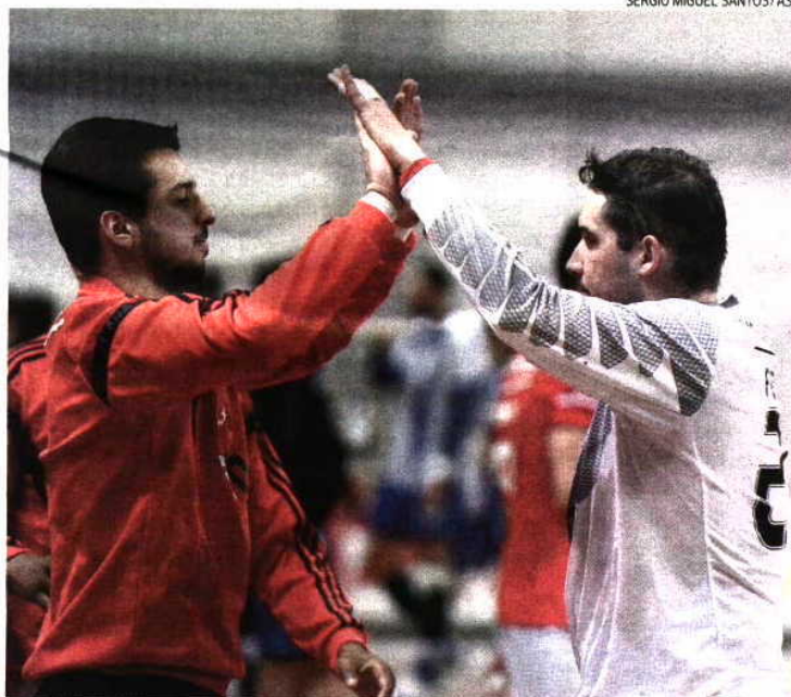
Benfica precisa de ganhar fora, frente ao Azoty Pulawy, para festejar na Taça Challenge