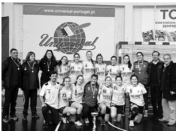
Juniores festejaram efusivamente título de campeãs regionais

A fase final do campeonato regional de juniores femininas decorreu no pavilhão do Colégio de Gaia, e as equipas participantes foram o Colégio de Gaia, Alpendorada, Cale e São Félix. No primeiro dia da prova,