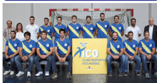
Jovens valentes entre os tubarões