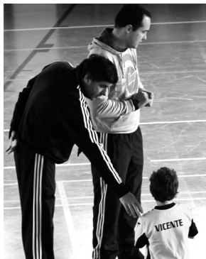
Bambis iniciam os treinos