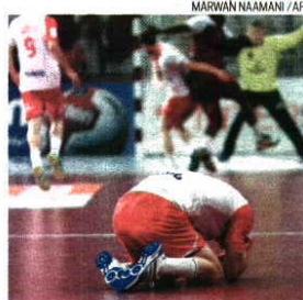
Polacos muito queixosos da arbitragem

O Catar venceu a Polónia por 31-29 na meia-final do Campeonato do Mundo e será a primeira nação fora da Europa a aceder a uma partida decisiva de um Mundial. A jogar em casa, os cataris tiveram, uma vez mais, no guarda-redes Danijel Sa-