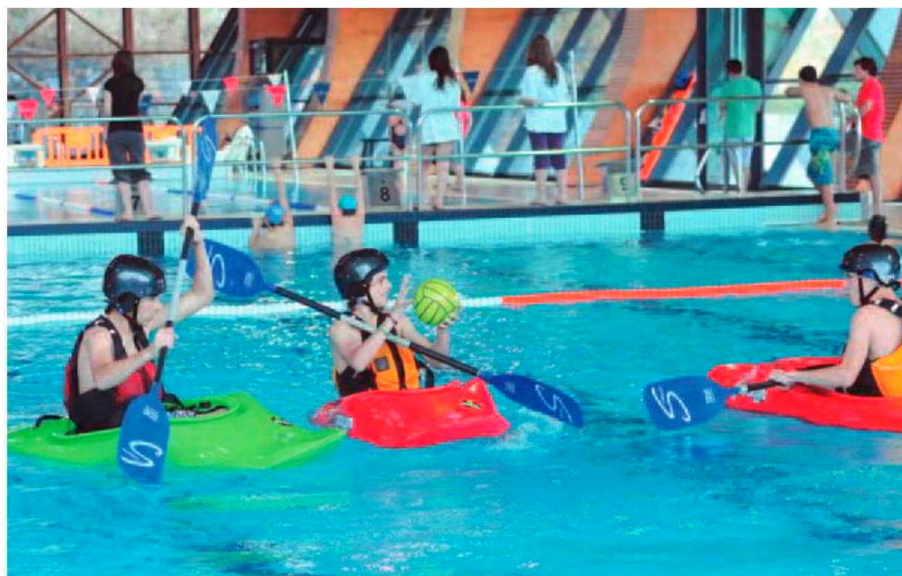
Nova modalidade já é jogada nos escalões de infantis, iniciados, juvenis e juniores.