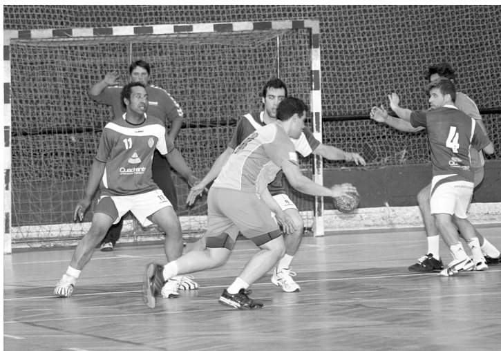
Feirense garantiu um importante triunfo diante do CA Leça

Agora vem o I. Madalenense no Pavilhão da Lavandeira, a 21 de Maio, às 20:30h, jogo que os blues têm de vencer para alimentar a esperança de manutenção, esperando que o seu último adversário