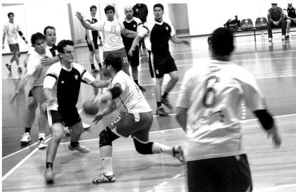
O Tondela AC continua na luta pela manutenção

O resultado é, por demais, evidenciador da superioridade dos nelenses num jogo que se