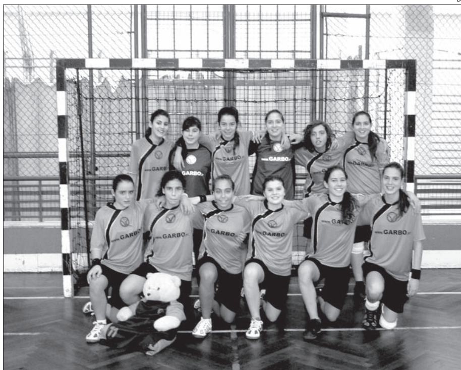
Equipa de Riba D' Ave garantiu subida à I Divisão de andebol (feminino)