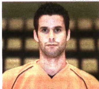
Guarda-redes maiato quer novos desafios