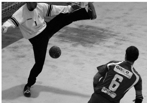
EM MASCULINOS AC Sismaria voltou a encontrar a rota das vitórias

Em frente na Taça de Portugal Colégio João de Barros e Juve Lis seguem na Taça de Portugal.