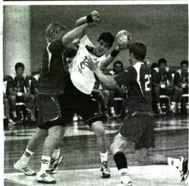
JOVEM. Pesqueira promovido aos seniores

ANDEBOL → PORTUGAL PREPARA DESAFIOS COM ESPANHA E MACEDÓNIA