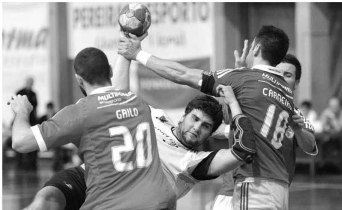
Os madeirenses revelaram muitas deficiências e enorme fadiga

HERBERTO DUARTE PEREIRA desporto@dnoticias.pt