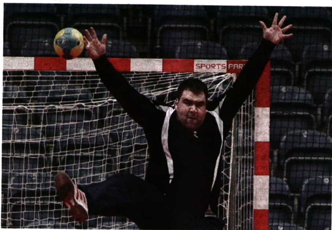
A CADEADO. Guarda-redes fechou a baliza e ajudou a quebrar a invencibilidade do Sporting