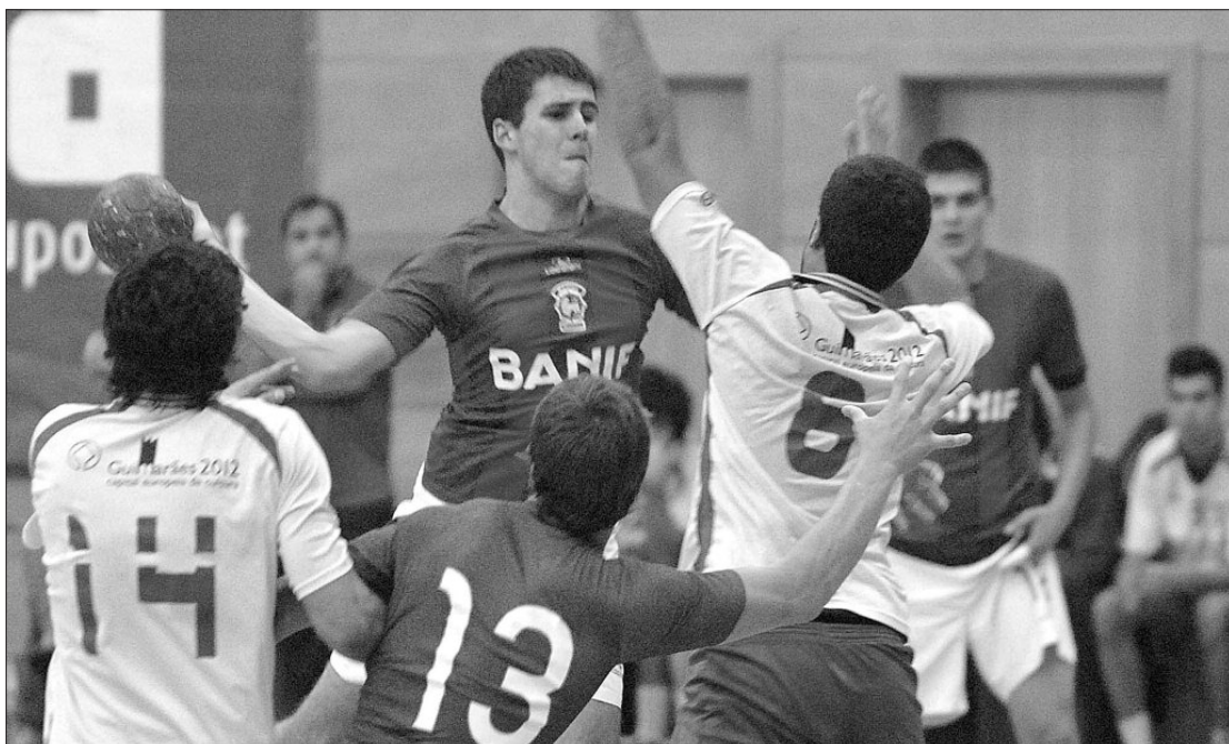
● Em Santo António, os jovens "verde-rubros" derrotaram o Xico Andebol por 39-33.

1.ª Divisão, e em jogo referente à 3.ª jornada, o Marítimo recebeu, em Santo António, e venceu o Xico Andebol, por 39-33, com os "verde-rubros" sempre na frente do marcador. Ao intervalo, o Marítimo já vencia por 18-14. Na 2.ª metade, o Xico Andebol tentou equilibrar, na tentativa de poder chegar à vitória, mas os insulares conseguiam gerir a vantagem, não se deixando surpreender pela reacção do adversário. No final, vitória justa