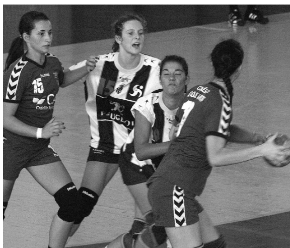
COLÉGIO continua a projectar o andebol feminino na região