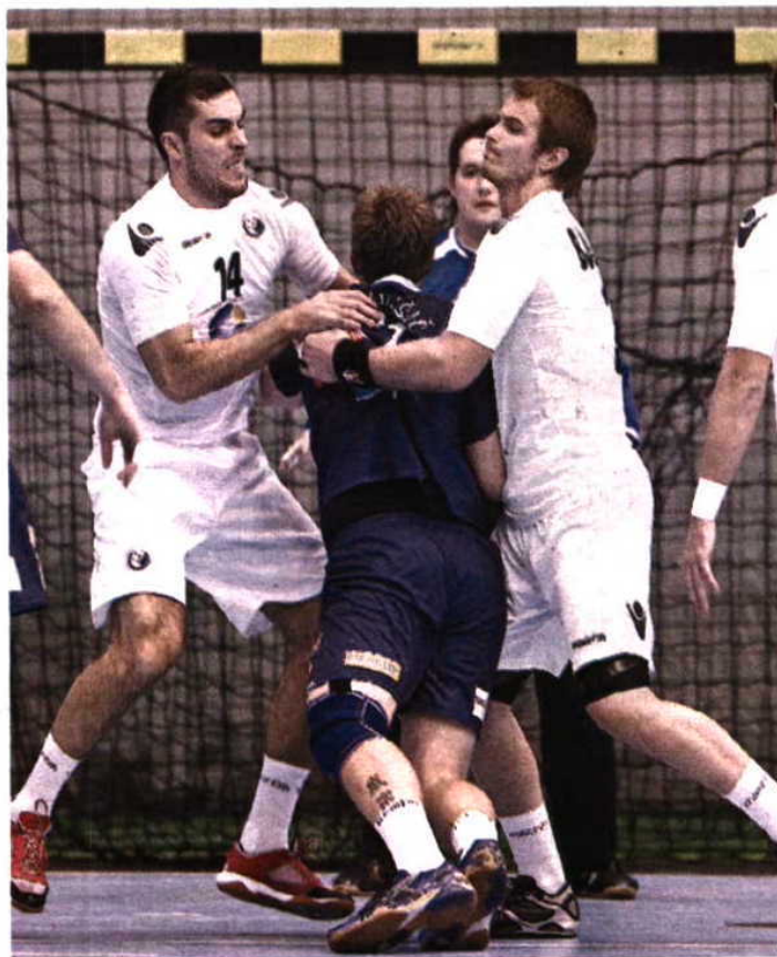
AZAR. Portugal teve dificuldades em Celje, perdendo por 31-34