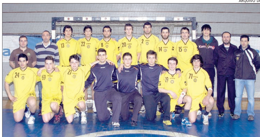
Juniores do ABC vão lutar pelo título nacional, em Resende

Sporting e Belenenses medem forças às 18h30.