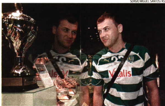
Romeno visitou o museu do Sporting e apreciou o troféu da Taça Challenge