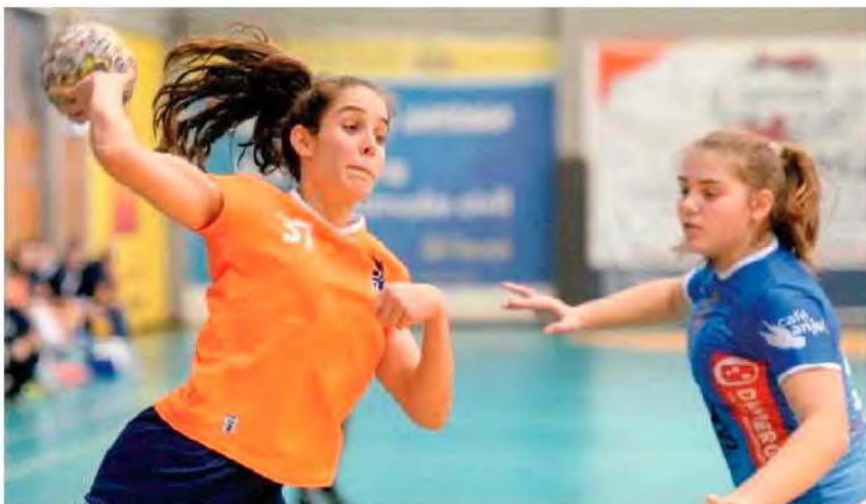
CS Madeira não foi feliz frente ao Alcanena.