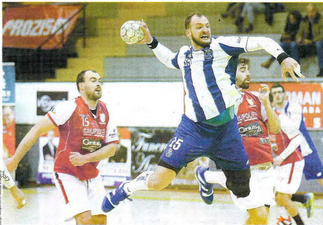
Jorge Magalhães / Global Imagens