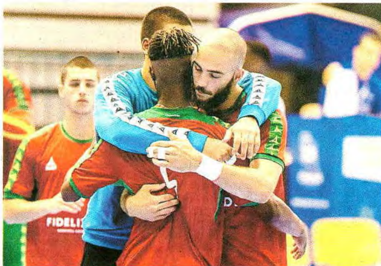
Jovens portugueses estão a causar sensação no Europeu de sub-20

Depois de na véspera ter alcançado uma das mais importantes vitórias neste escalão, precisamente sobre a França (32-28), ontem superou a Dinamarca, por 31-29 (14-11 ao intervalo). Os comandados de Nuno Santos efetuaram uma exibição sem quebras, mantendo um nível (alto) que permitiu estar quase sempre confortável no marcador, ou pelo menos a não ter de correr atrás de um resultado adverso. Portugal chegou a comandar por cinco golos de vantagem, mas nos últimos quatro minutos teve de desfazer um empate (28-28), marcando três golos, contra um dos escandinavos.