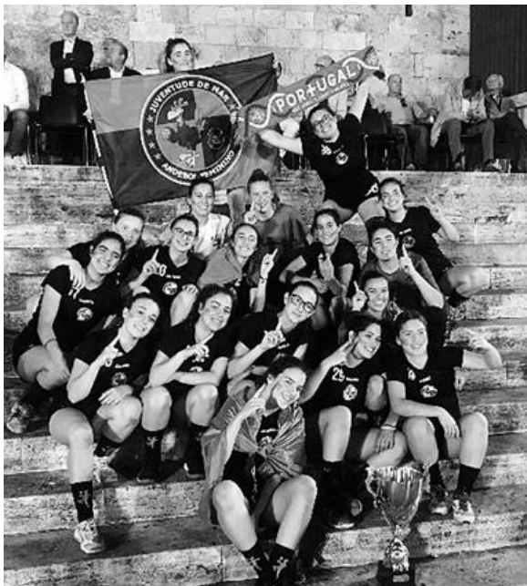
Jovens esposendenses foram a Itália ganhar prestigiado torneio internacional