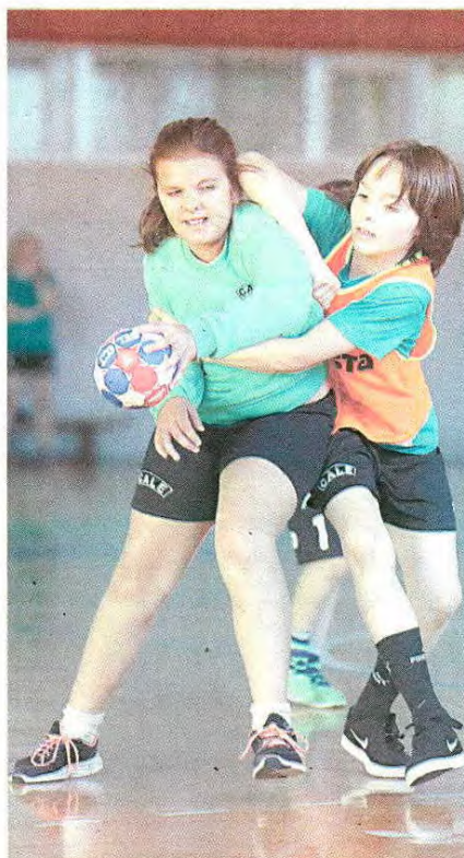
O CALE tem equipas em todos os escalões masculinos e femininos. A aposta na formação tem rendido ao clube títulos nacionais e regionais