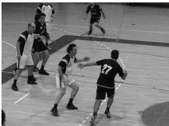
Académico e Académica defrontam-se pela 3.ª vez esta época