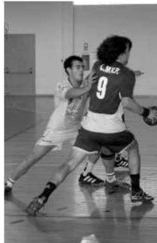
Marienses perderam fora