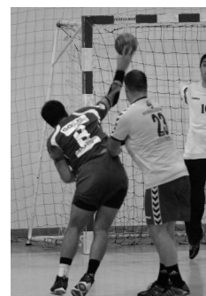
JUVE conseguiu primeira vitória