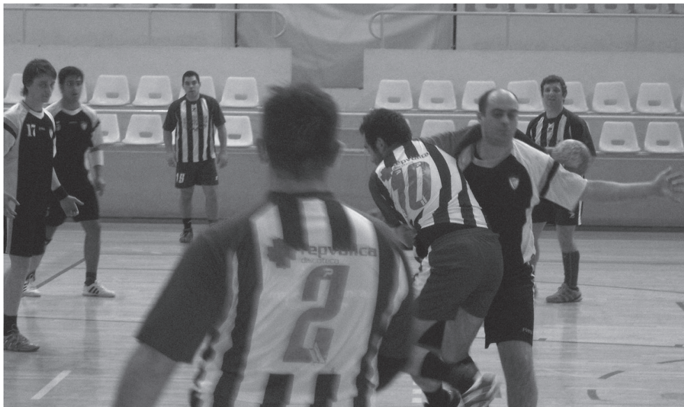
ADA redimiou-se das duas derrotas sofridas na primeira fase do campeonato