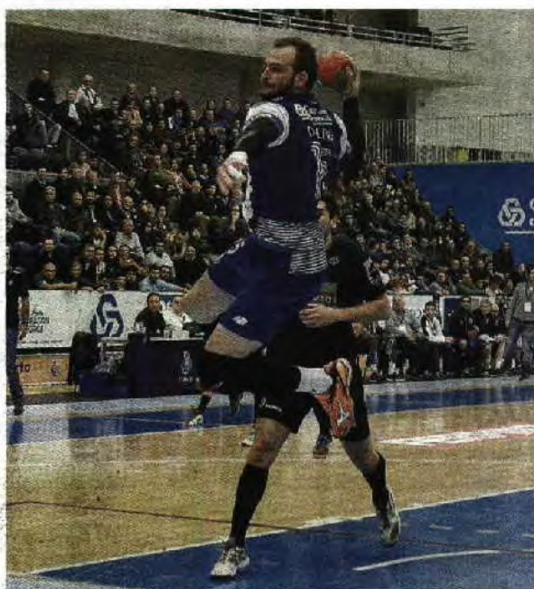
Van Der Valk Global Imprints

FC Porto disputa o próximo jogo da Taça em casa