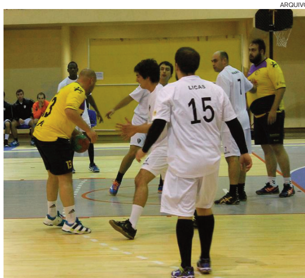
Equipas encontram-se na próxima jornada