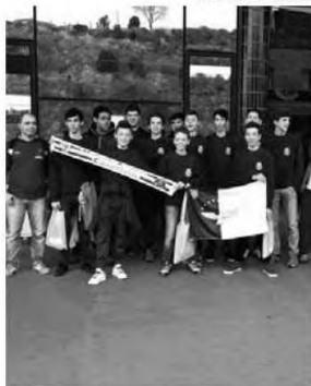
Comitiva do Marítimo