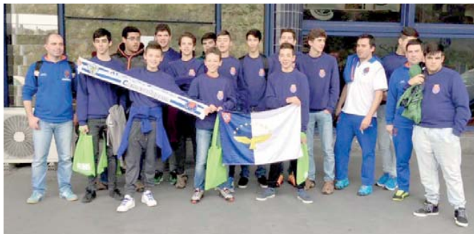
A equipa de iniciados de andebol do Marítimo, no Aeroporto de Ponta Delgada, aquando da partida para o Porto

A participação da equipa de iniciados de andebol do Marítimo neste torneio no continente (pela primeira vez uma equipa insular esteve presente neste