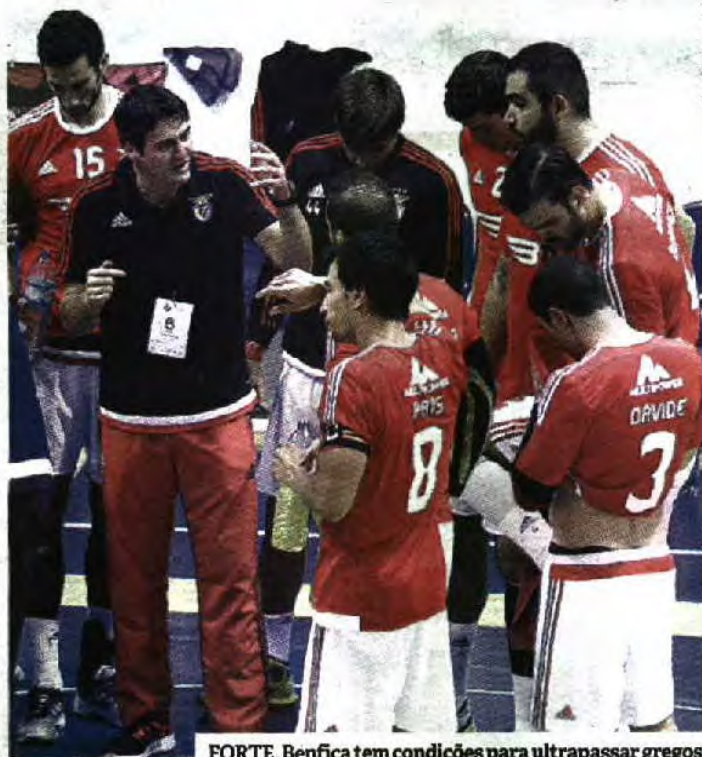
FORTE. Benfica tem condições para ultrapassar gregos

Quanto ao ABC, dispensa apre- sentações. O finalista da Cham- pions'1994 e da Challenge'2015, que já eliminou o detentor do tro- féu, terá pela frente um conjunto que nunca passou das rondas ini- ciais das provas europeias. ●