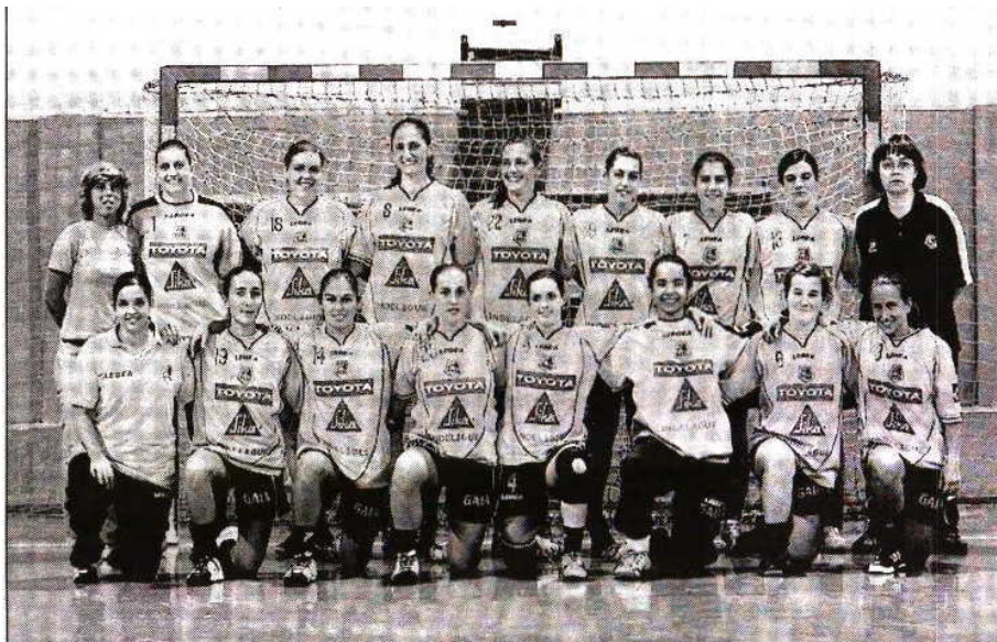
Colégio de Gaia vai participar de novo nas competições europeias