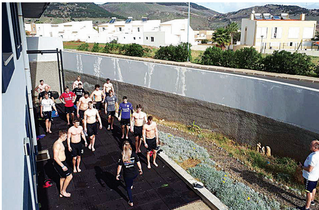
Os plantéis têm treinado no pavilhão multiusos do Porto Santo, bem como no ginásio BR GYM Health Club.

Mors-Thy e Ribe-Esbjerg, que ocupam respectivamente os 6.º e 10.º lugares da liga dinamarquesa, vão permanecer na 'Ilha Dourada' durante uma semana, em estágios.