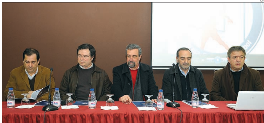
Federação e Associação de Andebol de Braga na assinatura do protocolo

A Federação de Andebol de Portugal rubricou um protocolo com a EB 2,3 de Celorico de Basto, que se destina a apoiar a prática do andebol com incidência no projeto "Inovar para vencer – A escola e família como meta".