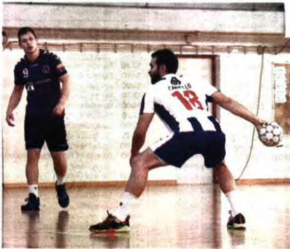
Carrillo foi o melhor marcador do FC Porto