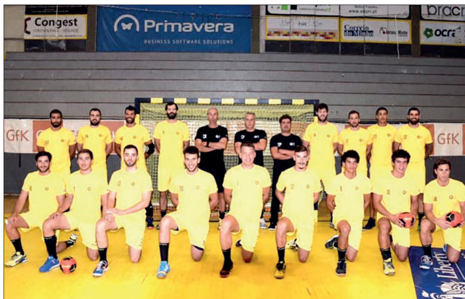
ABC apresenta amanhã a sua equipa aos associados