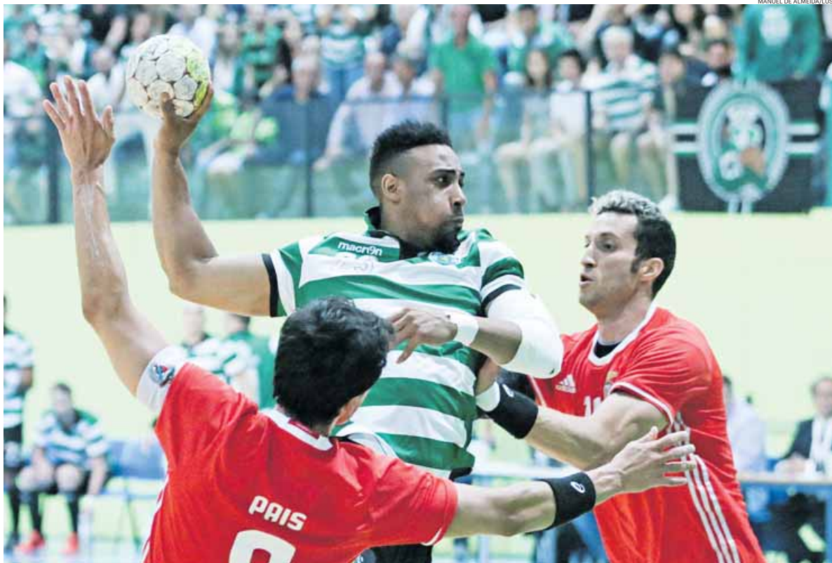
Apesar da reacção do Benfica na segunda parte, o Sporting impôs-se em Odivelas e assegurou o seu 18.º título nacional

Os primeiros minutos da segunda parte confirmaram essa tendência do jogo, com a equipa de Hugo Canela a dilatar a diferença no marcador para nove golos aos 34' (18-9). O jogo parecia entregue, tal era o domínio “leonino”, mas a história recente do andebol sportinguista mostra que a equipa nem sempre gere vantagens