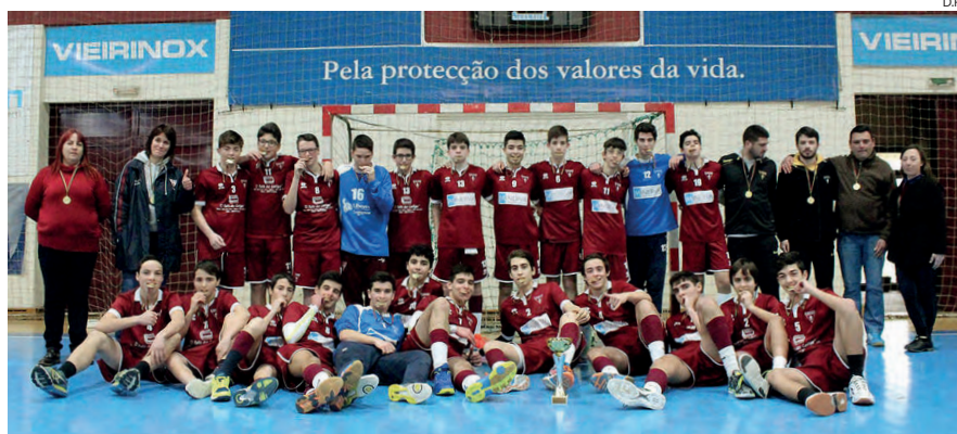
S. Bernardo é o actual campeão distrital de Aveiro

Integrada na Zona 1, juntamente com o Águas Santas e o Colégio dos Carvalhos, a equipa aveirense inicia a fase final medindo forças precisamente com a formação oriunda do Porto, esta tarde, a partir das 17 horas, tendo encontro agen-