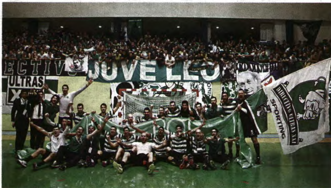
O Sporting festejou, ontem à noite, a conquista de um título que já lhe escapava das mãos há 16 anos

Andebol Vitória no dérbi com Benfica (25-23) permite aos leões garantir o 18.º campeonato