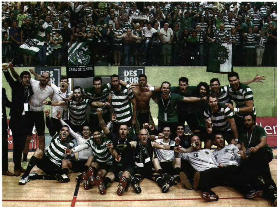
Sporting terminou a travessia do deserto e passou a ter um recorde de 38 troféus, incluindo 18 títulos nacionais

A festa foi rija, com as lágrimas e os sorrisos de alegria dos jogadores e treinadores a contagiarem os adeptos. "Campeões, campeões", ouvia-se em todo o recinto, numa comunhão de longos minutos, celebrando um título que se revelou bem mais difícil do que as contratações de início de época deixavam antever. O Sporting arrancou como favorito, mas a caminhada invicta do FC Porto na primeira fase alterou os prognósticos. Ago-