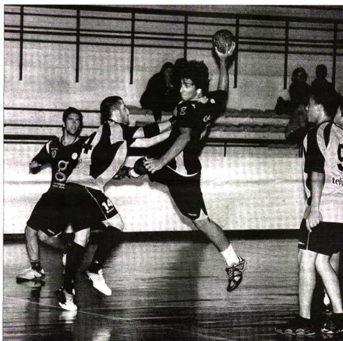
Gaia esteve forte nas transições atacantes

O conjunto gaiense não teve muitas dificuldades para se superiorizar à formação de Paulo Nogueira e apresentou uma equipa muito coesa defensivamente, que esteve agressiva o quanto bastou num sistema 6x0 e que limitou de sobremaneira