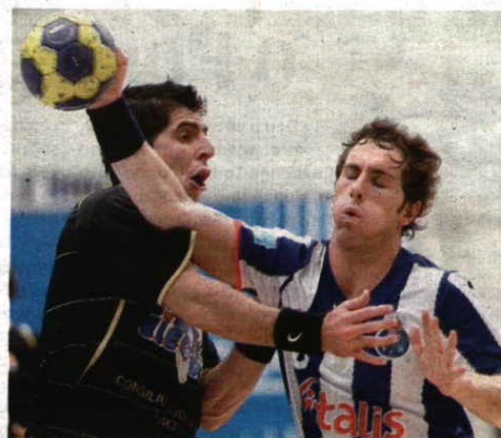
FC Porto - Depois de uma equipa romena, uma húngara