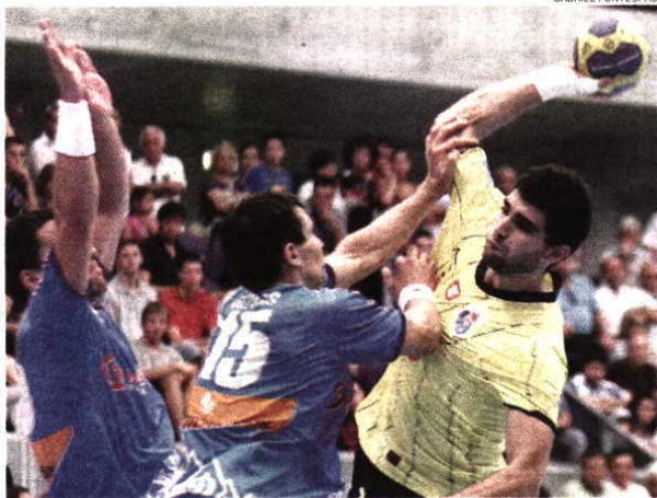
FC Porto falhou a entrada na Champions e não teve muita sorte no sorteio da EHF