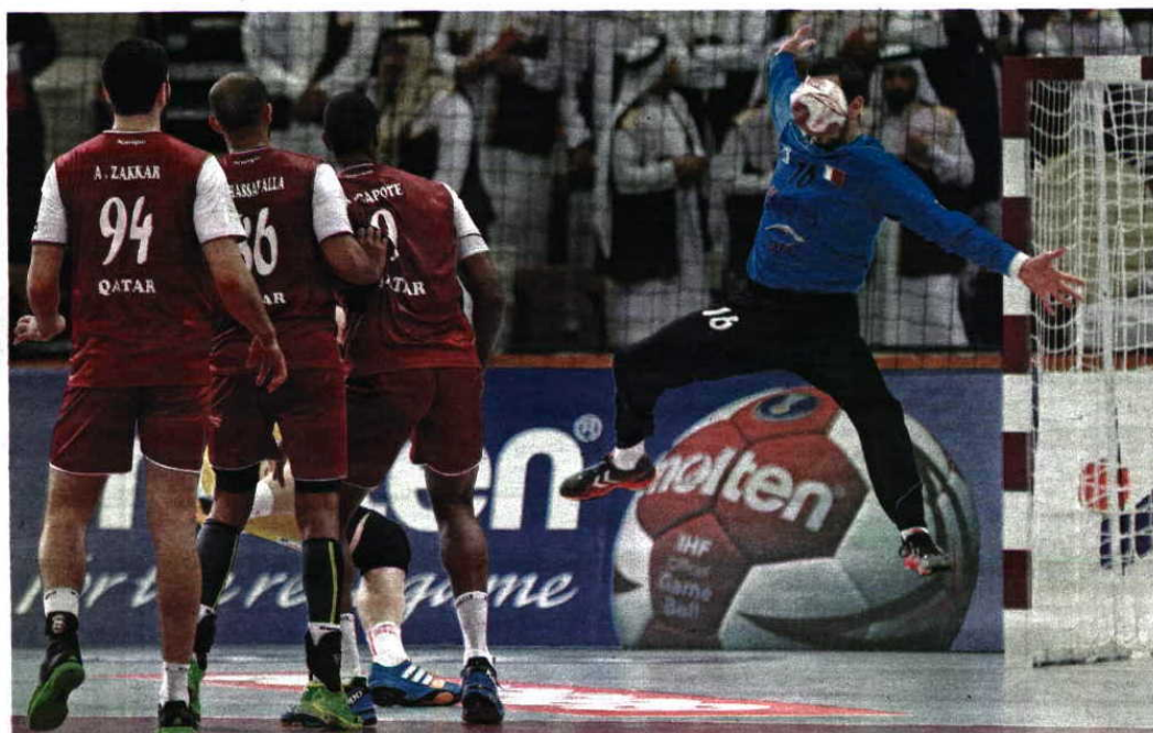
Com guarda-redes de classe mundial e uma defesa agressiva, o Qatar tem somado vitórias

Para que nada faltasse à sua selecção, a organização do evento recrutou 60 adeptos espanhóis da Furia Conquense, a claqué mais emblemática de andebol de Espanha, para apoiarem a selecção da casa, com todos os instrumentos com que conseguissem viajar. Mesmo no jogo contra a Espanha, uma imposição que acabou por ser retirada. Em troca têm tudo pago, os voos, um bom hotel com todas as refeições incluídas, e livre-trânsito para os jogos. Alguns não conseguiram dispensa do trabalho, como o próprio presidente da claqué, mas dos que foram muitos são desempregados e outros até pertencem a grupos de apoio de outros clubes de Espanha. O pior é mesmo não poderem beber álcool, mas são as regras.