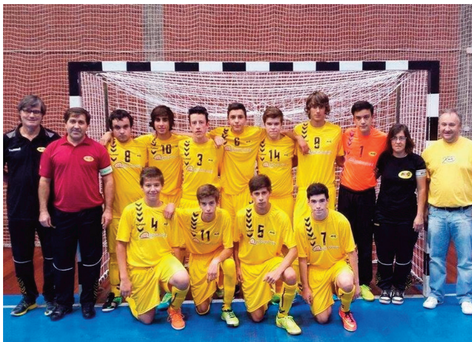
Juvenis do ABC de Nelas já marcaram 363 golos e são a equipa mais concretizadora

Quem mantém estatuto de candidato aos primeiros lugares é o ABC de Nelas que man-