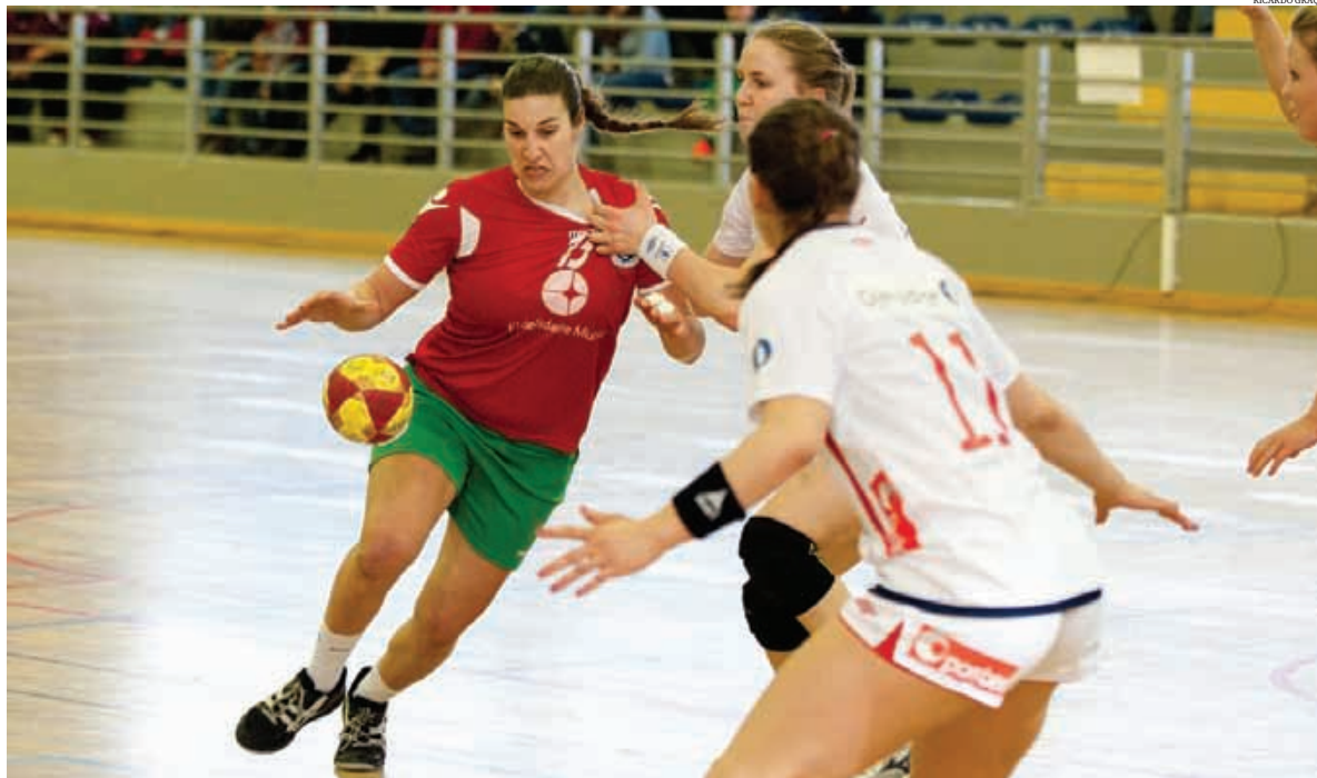
Reforço do HAC Handball é figura de destaque da selecção portuguesa

A primeira linha vai alinhar no HAC Handball, clube francês que ocupa o quinto lugar da principal competição gaulesa, mas que é detentor de um palmarés de respeito. Venceu a competição europeia Challenge Cup em 2012 e a Taça de França em 2006 e 2007. No campeonato francês, o melhor resultado obtido pelo HAC Handball foram os segundos lugares em 2006, 2007, 2008, 2009 e 2010. Na temporada passada não foi além do terceiro lugar. “Contactaram-me há cerca de um mês. A