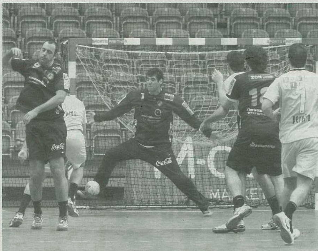
Os madeirenses surpreenderam, uma vez mais, pelo arrojo defensivo com que 'brindaram' o Porto.