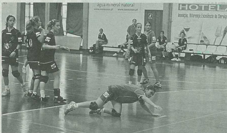
O Sports Madeira é o grande candidato ao título regional de juniores femininos.

A formação da Escola Bartolomeu Perestrelo, que defende o título regional bem como o título nacional, ambos conquistados na época passada, não teve argu-