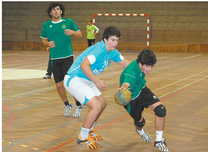
■ Os caldenses estavam a ganhar por quatro golos a quatro minutos do fim

A equipa caldense realizou um jogo muito bom da parte defensiva, em que conseguia neutralizar os ataques adversários, o que causava nervosismo nos atletas Leirienses, que não era algo muito fácil de acontecer, pois estamos a falar de uma equipa que na época passada foi vice-campeã nacional da 1ª divisão nacional de iniciados, o que demonstra o valor dos seus atletas. Já no ataque os nossos jovens