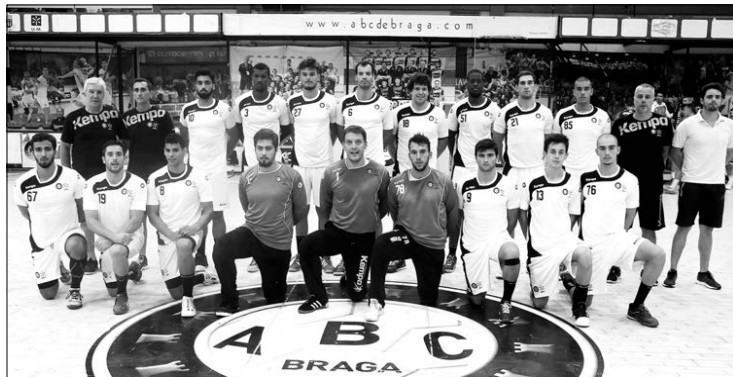
O plantel do ABC/UMinho no dia da apresentação a sócios e adeptos