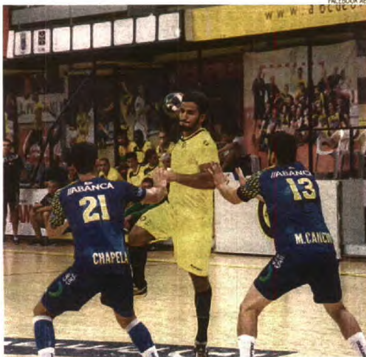
Equipa minhota brindou adeptos com vitória no jogo de apresentação em casa