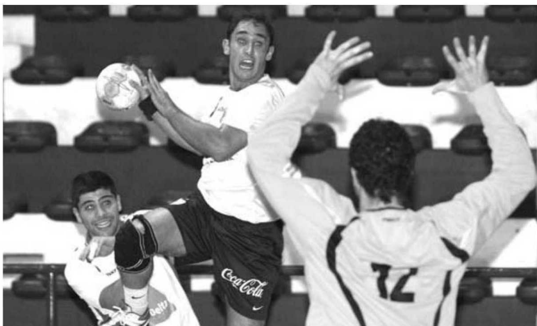
Madeirenses tiveram sorte no sorteio da prova que se disputa entre 27 e 28 de Maio em Tavira.