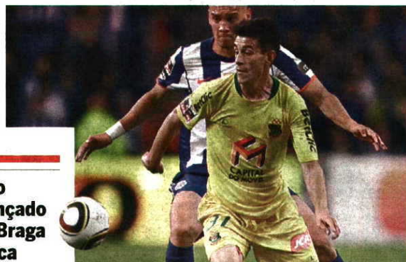
Pizzi tem mais dois anos de contrato com o Sp. Braga

Tanto Jorge Jesus como Luís Filipe Vieira gostariam de contar com jovens portugueses de qualidade no plantel. Contudo, ambos chegaram à conclusão de que há poucos com capacidade