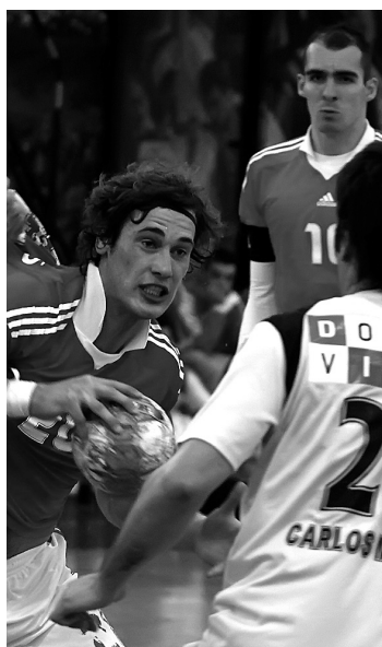
FC Porto. «Dragões» medem forças com Benfica nas meias-finais da Taça de Portugal

O FC Porto-Benfica realiza-se às 15h05 de dia 27, enquanto Madeira SAD e Belenenses defrontam-se às 17h00. Os vencedores medem for-