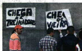
Contestação no Estádio da Luz

● Durante a tarde de ontem, alguns elementos do Movimento Benfica aos Benfiquistas colocaram alguns cartazes nas paredes do Estádio da Luz, de protesto contra Luís Filipe Vieira. A acção decorreu sem incidentes e posteriormente os cartazes foram retirados por elementos da segurança do estádio.