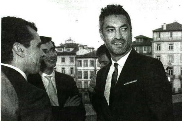
Vitor Baia regressou aos convívios da família azul e branca