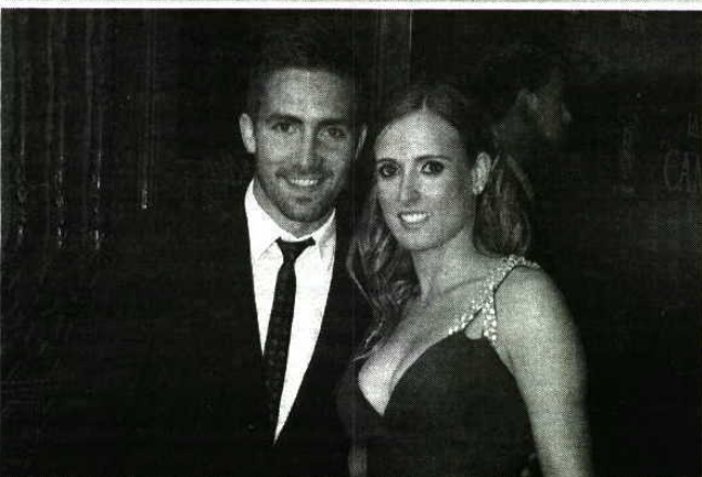
João Mourinho e a esposa celebram os primeiros títulos no F.C. Porto