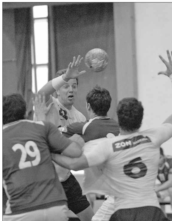
Madeira SAD defronta o Belenenses na Final Four da Taça de Portugal.

Dos dois clubes presentes no sorteio (FC Porto e Benfica), apenas o representante 'encarnado' falou à comunicação social, considerando que "teoricamente são duas das equipas mais fortes, mas a Taça é sempre Taça" e "qualquer clube pode ganhar".