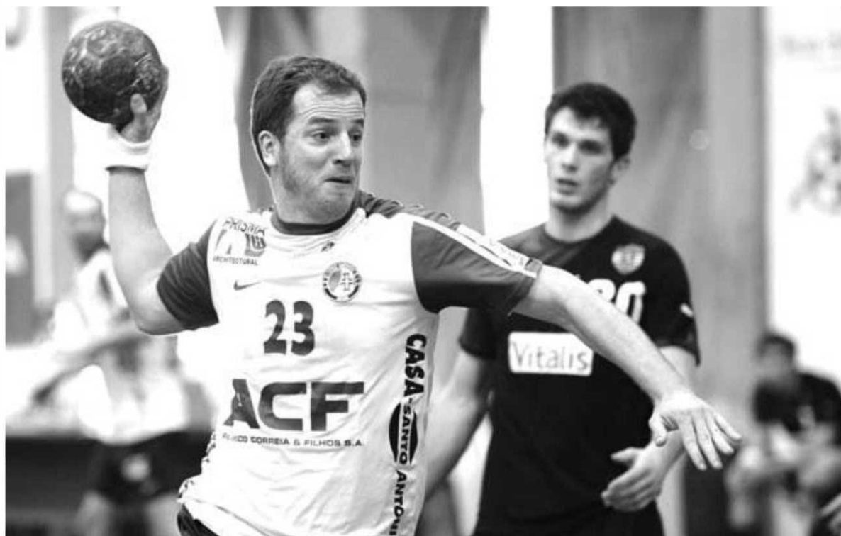
O empate em casa do Sporting serviu os objectivos dos madeirenses.