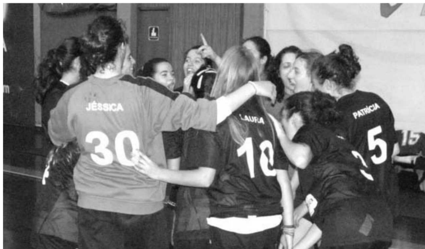
Académico do Funchal volta a lutar por mais um título de iniciados esta temporada.

Assim sendo nos masculinos o campeão Académico mostrou domínio na série A e atingiu assim a final, onde terá pela frente o Mari-