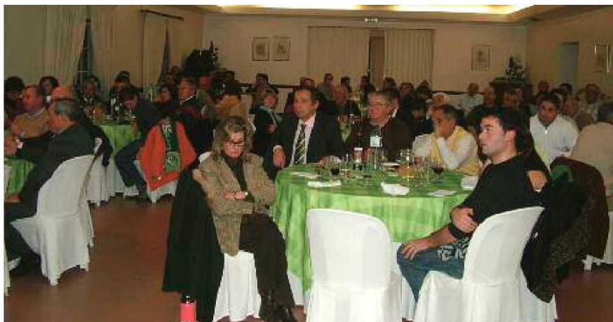
Mais de uma centena de pessoas marcaram presença no jantar