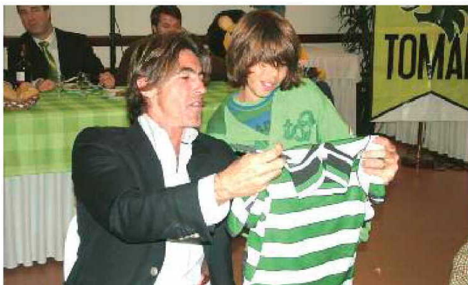
Sá Pinto distribuiu autógrafos