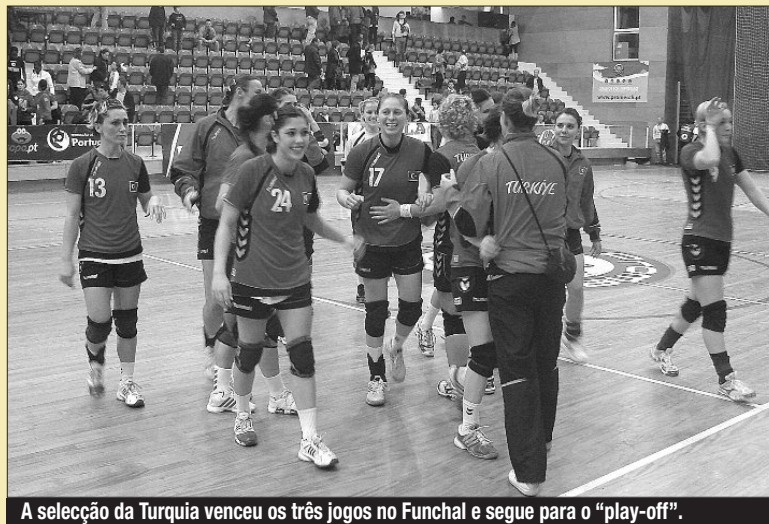
A selecção da Turquia venceu os três jogos no Funchal e segue para o "play-off".