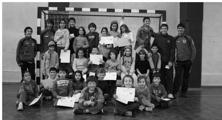
ANDEBOL SIR aposta na formação

Foram três dias com muitos jogos e actividades, com e sem bola, que serviram para os