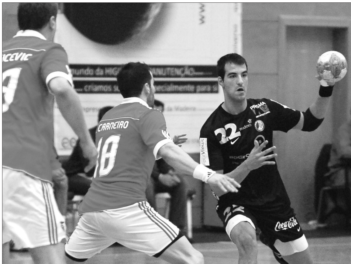
A "sociedade" deixou escapar, no último domingo, o triunfo com o Benfica e agora quer manter-se na Taça.