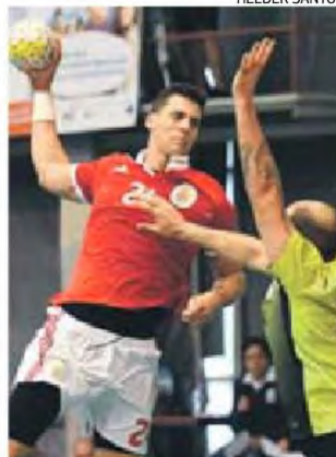
Cavalcanti marcou seis golos