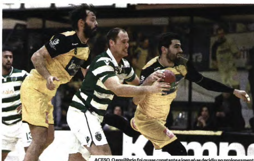
ACESO. O equilíbrio foi quase constante e jogo só se decidiu no prolongamento

Não faltaram os ingredientes principais para uma meia-final imprópria para cardíacos: equilíbrio, incerteza no marcador e ambas as formações com uma vontade enorme de ganhar. Tudo isso se conjugou em Braga, com a vitória a sorrir aos leões no final do primeiro pro-