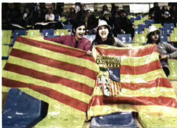
Há 60 equipas espanholas a competir, contra as 57 portuguesas

Um dos momentos altos acontece na noite de amanhã, quando os jovens craques lutarem pela melhor habilidade, no "Best Trick Show". "Fomos nós que trou-