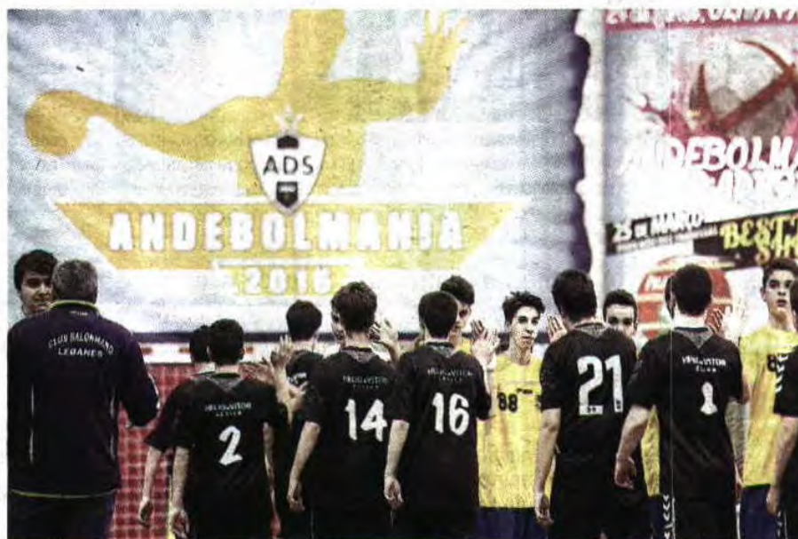
Jovens de 120 equipas estão a competir na edição de 2016, a primeira que conta com a França

► Mais de 1700 atletas vão levar, até depois de amanhã, sábado, em São João da Madeira, o andebol a uma nova dimensão. A edição 2016 do AndebolMania bate todos os recordes e, pela primeira vez, ultrapassa os limites da Península Ibérica, ao registar a presença de três equipas francesas, que se juntam a 60 espanholas e 57 portuguesas. A organização estima um impacto de cerca de 500 mil euros na economia local.