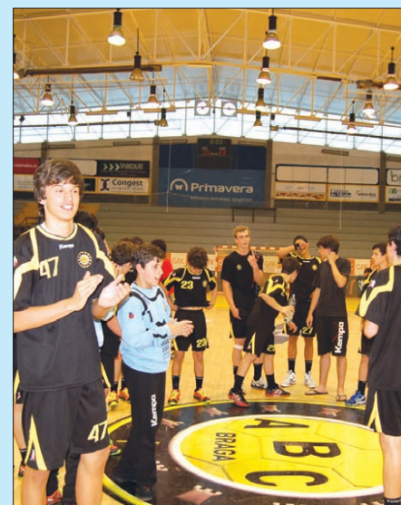
Jogadores do ABC festejam passagem à final

Na fuga ao último lugar, o Sporting venceu o Alavarium ACA por 33-28 e ficou em 5.º lugar, confirmando também a sua superioridade em relação aos aveirenses. A discussão do 3.º lugar está marcada para as 10h00, no Pavilhão Flávio Leite, e será entre o Águas Santas e o Lagoa. Duas das boas equipas a disputar o último lugar do pódio.