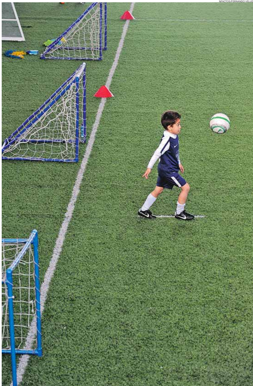
A detecção precoce e o devido encaminhamento dos talentos desportivos é levada a sério em Guimarães

A partir daqui, sempre que um aluno demonstrar aptidões espe-