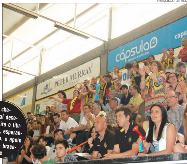
Os miúdos do ABC de Braga venceram e jogam a final com o Benfica. O público do Flávio Sá Leite ajudou a equipa a acordar quando foi necessário

JOGO DO TÍTULO NACIONAL MARCADO PARA HOJE, 12H00, NO SÁ LEITE