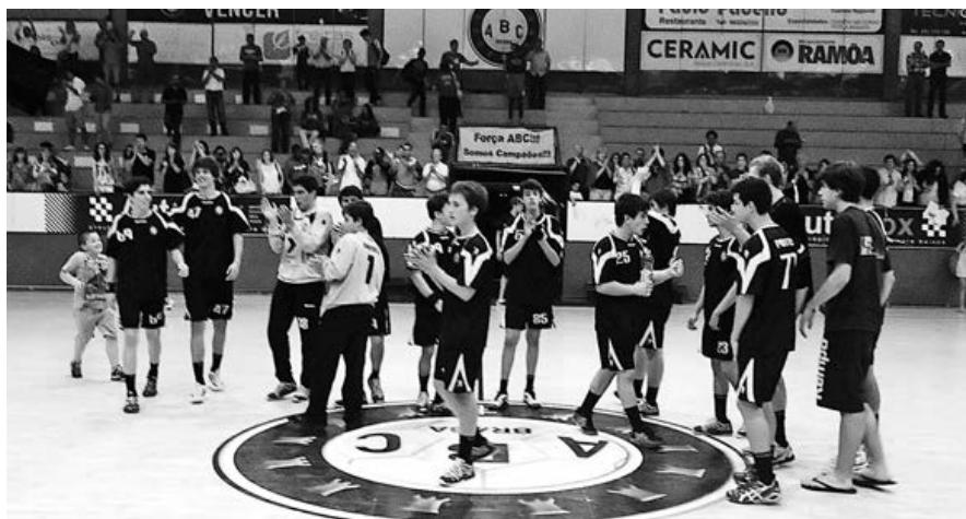
Jovens academistas fizeram a festa depois de terem conquistado a vitória sobre o Lagoa e a presença na final

Cm um triunfo (35-33) arrancado a ferros sobre o Lagoa, o ABC garantiu um lugar na final do campeonato de iniciados e tenta, hoje, conquistar o título no confronto com o Benfica.