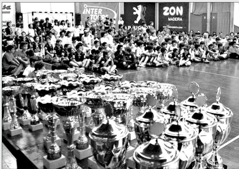
Melhores da época serão distinguidos esta tarde, no Pavilhão do Funchal.

Entre as 17h45 e as 19h00 de hoje, no Pavilhão do Funchal, a Associação de Andebol da Madeira, (AAM) fará a entrega de prémios referentes à época desportiva 2012/2013. Momento para homenagear os que mais se destacaram, ao longo da temporada, bem como o reconhecimento por parte da instituição de uma temporada, onde, conjuntamente, foi possível concretizar tudo o que estava previsto, em termos de plano de actividades. Na cerimónia serão, então, entregues os prémios relativos às competições regionais, assim como aos elementos que se destacaram individualmente. Será, também, uma oportunidade de homenagear a equipa do Club Sports da Madeira pelo título nacional alcançado no escalão de Juvenis femininos. A Associação promete, ainda, uma surpresa, que será o ponto alto da cerimónia de entrega de prémios. Ao longo do dia, entre as 9h e as 21h, também no Pavilhão do Funchal, decorre a iniciativa “Um Golo pela