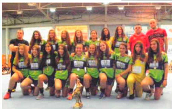
A Associação de Andebol da Madeira promoveu ontem ao final da tarde a habitual cerimónia de entrega de prémios aos vencedores de todas as competições promovidas por aquele organismo ao longo da época. Um momento que junto no palco do andebol, o Pavilhão do Funchal, todos os clubes da Região e muitos familiares que apadrinham um dos momentos de grande significado para andebol.

HERBERTO D. PEREIRA desporto@dnnoticias.pt