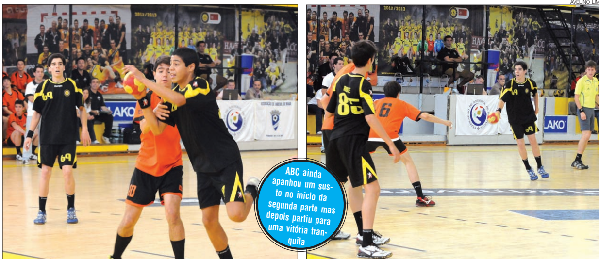
Os miúdos do ABC de Braga voltaram a vencer com tranquilidade e categoria, ajudados pelo público no Flávio Sá Leite