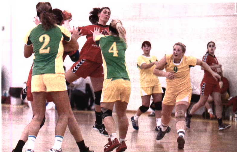
Juve Lis foi superior perante as letãs do Stopinu, no último domingo