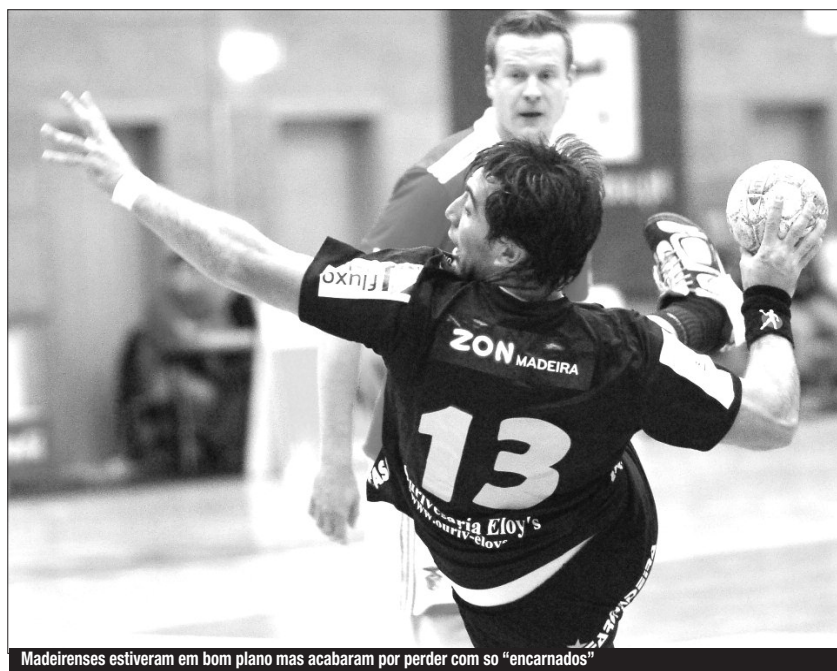
Madeirenses estiveram em bom plano mas acabaram por perder com os "encarnados"

O Madeira SAD perdeu ontem em Santo António frente ao Benfica por 26-25, um resultado que acaba por penalizar em demasia a formação insularque, por aquilo que conseguiu fazer ao longo de todo o jogo, merecia sair pelo menos com o empate.