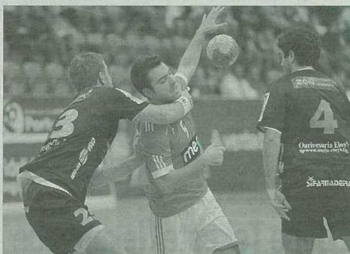
Os madeirenses realizaram uma má segunda parte