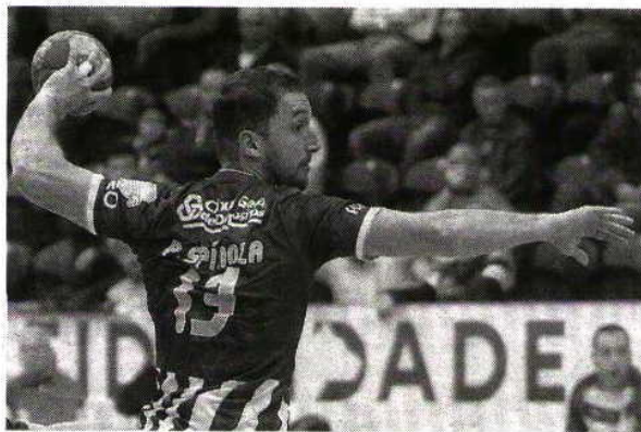
Cofiança > Spínola espera trazer três pontos da Luz