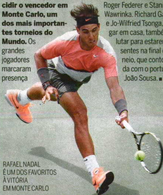
RAFAEL NADAL É UM DOS FAVORITOS À VITÓRIA EM MONTE CARLO