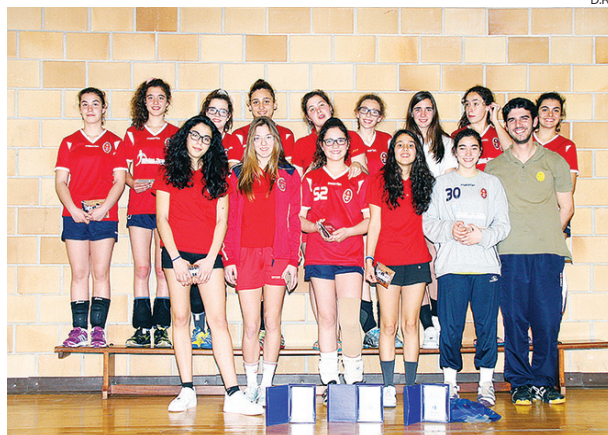
Os jogadores da Casa do Povo de Valongo do Vouga