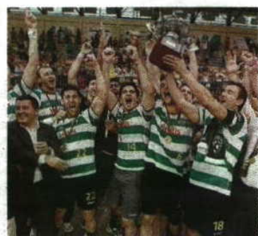
VÍDEO: PATRICIA RODRIGUES / ALCAANTARA PRESS / GLOBA

Depois de quatro anos seguidos em Tavira, a final-four da Taça de Portugal desta época vai jogar-se, pela primeira vez, na Maia, Cidade Europeia do Desporto 2014. Marcada para o fim de semana de 12 e 13 de abril, ambas as competições, masculina e feminina, serão então decididas na cidade do Lidador, muito provavelmente no pavilhão do Águas Santas, ainda que o recinto não esteja certo. Também a fase de qualificação para o Europeu masculino de sub-20, que terá organização portuguesa e disputado também por Sérvia, Grã-Bretanha e Holanda, terá lugar na Maia, entre 4 e 6 do mesmo mês.