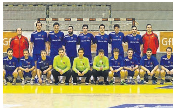
Equipa do Arsenal Devesa Andebol

Aos vencedores dos jogos da segunda eliminatória vão juntar-se os clubes da I Divisão, para disputar a próxima ronda da competição, cujos jogos serão a 7 de Dezembro próximo.