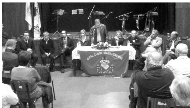
Ideal Clube Madalenense comemorou o 86º aniversário

► O Clube de Tiro de Gaia assinou um protocolo com o Ideal Clube Madalenense no sentido de utilizar o espaço para a prática e formação, de possíveis interessados, na modalidade de Ar Comprimido. Os treinos realizam-se às terças-feiras, das 20h às 23h e aos sábados durante a tarde. Os interessados em experimentar a modalidade podem contactar o responsável, José Silva através do número: 91 3401816.