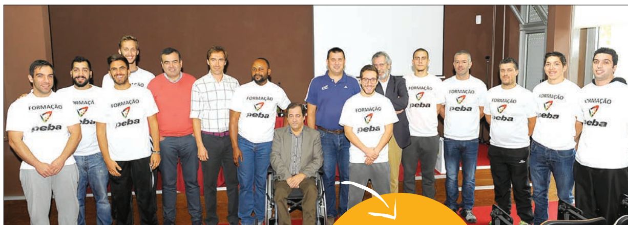
Os formandos que participam na ação

Ação decorre em Celorico de Basto e conta com 15 formandos