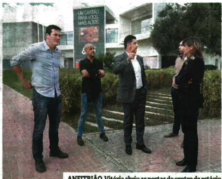
ANFITRIÃO, Vitória abriu as portas do centro de estágio