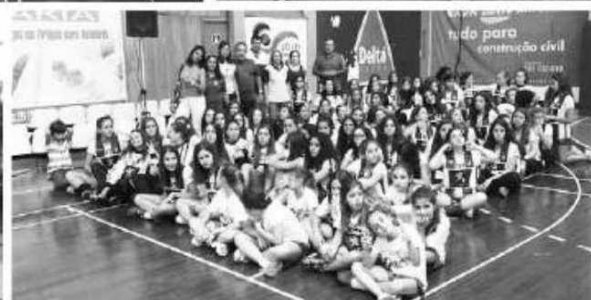
Andebol teve um fim-de-semana cheio de competição.