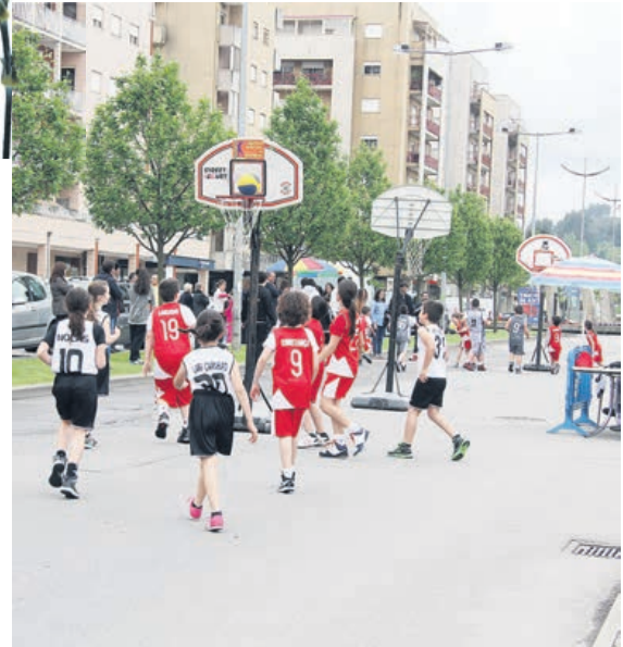
O desporto saiu à rua em Póvoa de Lanhoso

Lanhoso. As comemorações iniciaram-se pelas 10 horas, nos Paços do Concelho, com a cerimónia do hastear das bandeiras, pelos líderes dos três partidos com assento na Assembleia Municipal, e num momento que contou com a presença do presidente da câmara, vereadores, presidentes de junta e elementos da assembleia, aos quais se juntaram povoenses, num actosole-nizado pela Banda de Música dos Bombeiros Voluntários da Póvoa de Lanhoso.