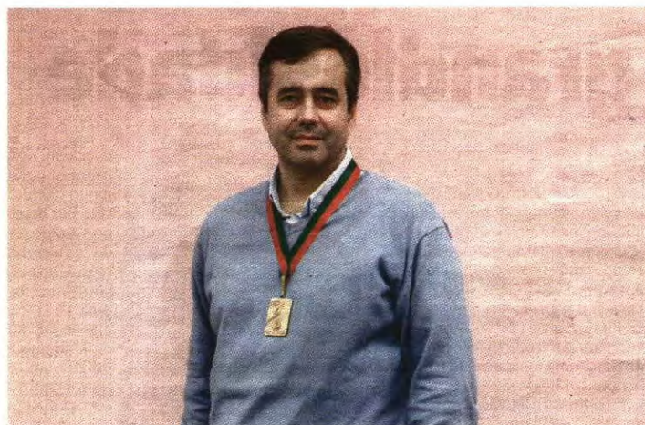
ARQUIVADO: GLOBA IMAGES

Pelo meio, ganhou o primeiro título sénior no F. C. Porto e deu uma grande alegria a Pinto da Costa. "Esta medalha é da Taça de Portugal de 1993/94, que ganhámos ao Benfica, por um, graças a um livre de nove metros com o tempo já esgotado. Foi o primeiro título de andebol desta direção", lembra.