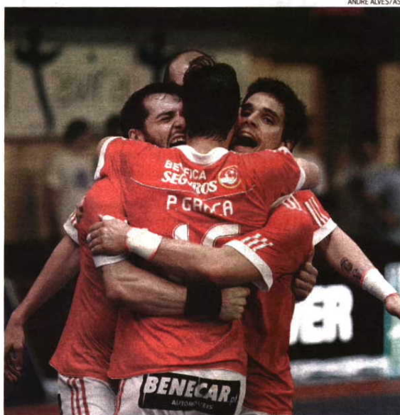
Benfica e FC Porto protagonizaram embate que fez justiça ao estatuto de clássico

CLÁUDIO PEDROSO Lateral-direito do Benfica