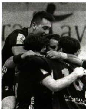
Imparáveis > Madeira SAD