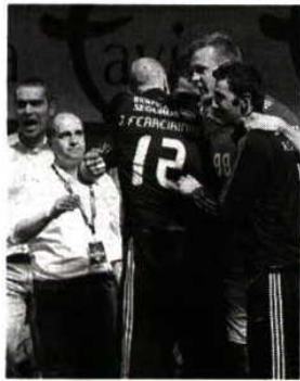
Festa > Equipa do Benfica