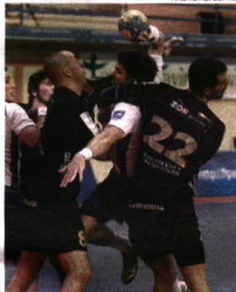
Jogo emotivo até ao fim