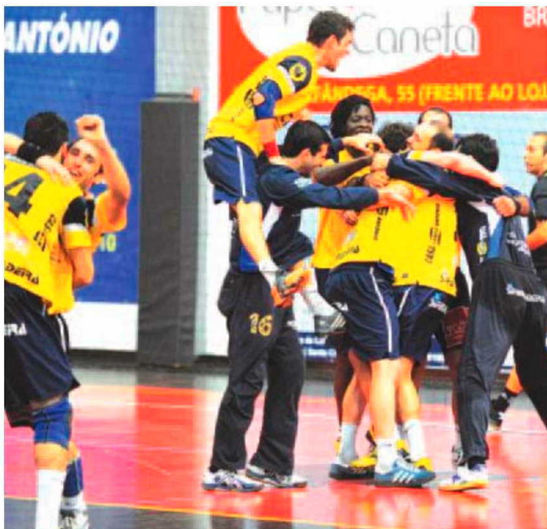
Vice campeão numa época cheia de problemas.

E a este nível, o Madeira Andebol SAD demonstrou ter a lição bem preparada. Em termos defensivos a estrutura revelou-se crucial para poderem barrar as mais valias contrárias, sobretudo Carlos Carneiro e José Costa. No ataque por conta de uma grande exibição de Daniel Santos, o 'sete' do Ma-