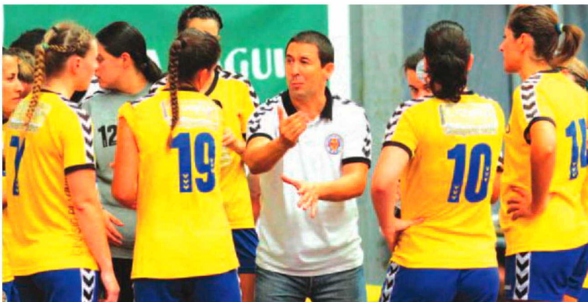
O Madeira SAD é a melhor equipa de Portugal esta época.

Ontem, na última partida da fase final, frente ao Alcanena, que apresentou sete jogadoras para esta partida, uma vitória fácil das madeirenses por 39-13, com 19-9 ao intervalo já favorável à SAD, madeirenses que recorde-se, apenas precisavam de empatar para a reconquista do título ser uma realidade. A fantástica vitória na véspera em casa do Gil Eanes