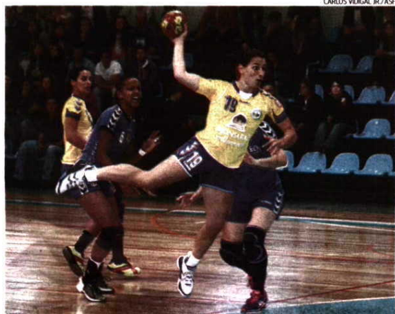
Madeirenses defrontam esta tarde o JAC-Alcanena e só depois poderão celebrar