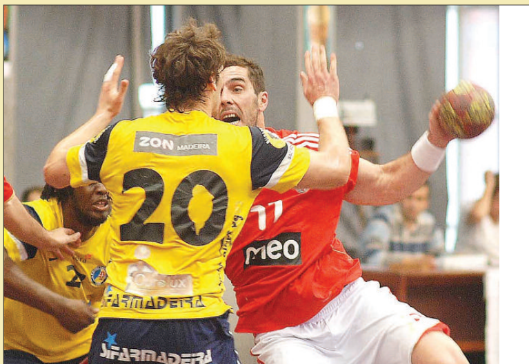
Numa época particularmente difícil, o Madeira SAD termina a liga num brilhante 2.º lugar

No fecho da Liga Portuguesa de Andebol Masculino, o Madeira SAD recebeu ontem o Benfica, vencendo por 27-26. A partida, disputada no Pavilhão do Funchal e referente à 10.ª, e última, jornada da fase final, fez por justificar a (boa) 2.ª posição da equipa madeirense, imediatamente atrás do