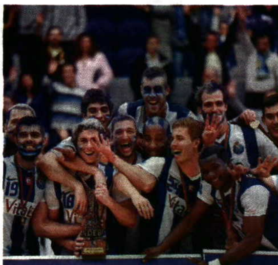
Os dragões receberam o troféu de campeões nacionais