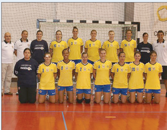
A equipa feminina do Madeira SAD conquistou o seu 12.º título de campeã nacional, retomando um ciclo iniciado em 1998/99 e que nas duas últimas temporadas havia sido interrompido pelo emergir do Gil Eanes, grande derrotada do campeonato que terminou ontem.

O Madeira SAD sagrou-se ontem campeão nacional de andebol feminino, vencendo, na última jornada, o JAC Alcanena, por 39-13, depois de na véspera se ter desenvencilhado do Gil Eanes, o anterior campeão.