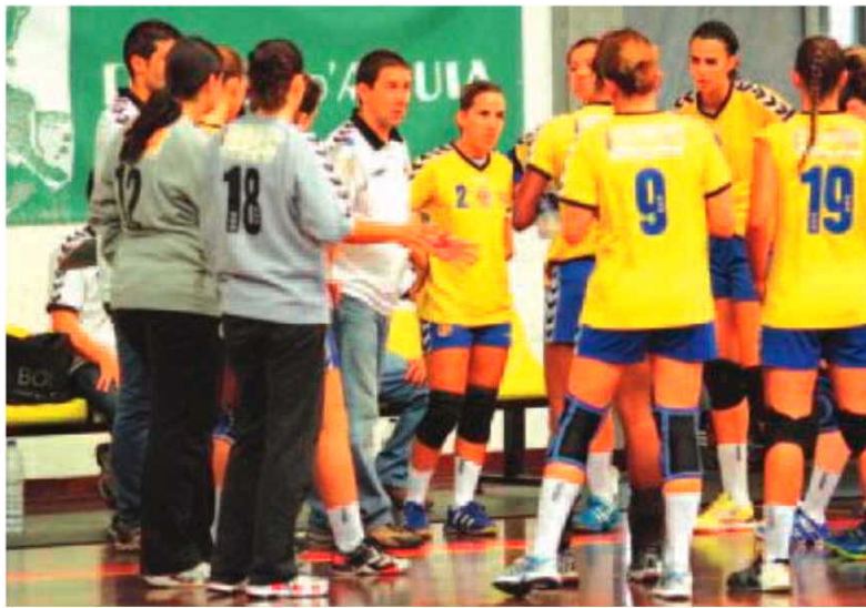
Excelente a prestação do Madeira SAD no reduto do Gil Eanes.