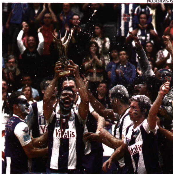
Jogadores receberam a taça de campeões e festejaram com os adeptos no Dragão Caixa